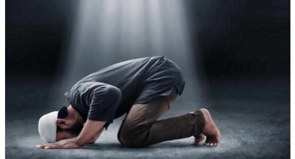
Figuur 2. Biddende man

Az-Zakaat is de derde geloofspijler van de islamitische religie en wordt vertaald als de verplichte armenbelasting. Door het wegschenken van een deel van hun financieel vermogen aan de minderbedeelden trachten moslims hun ziel te zuiveren. De welgestelde wordt hierdoor gevrijwaard van gierigheid en hebzucht en de armen worden door middel van deze financiële bijdrage beschermd van jaloezie tegenover de rijken. Het hogere doel hierbij is dus om een sociale rechtvaardigheid in de samenleving te creëren.