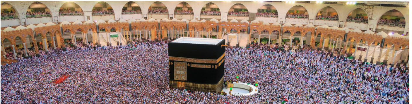
Figure 3. Mekka tijdens Pelgrimstocht

Naast het bevorderen van sociale cohesie door het gemeenschappelijke gebed en het gezamenlijk verbreken van de maaltijd, heeft het vasten ook als doel om empathie en solidariteit te ontwikkelen voor de minderbedeelden.