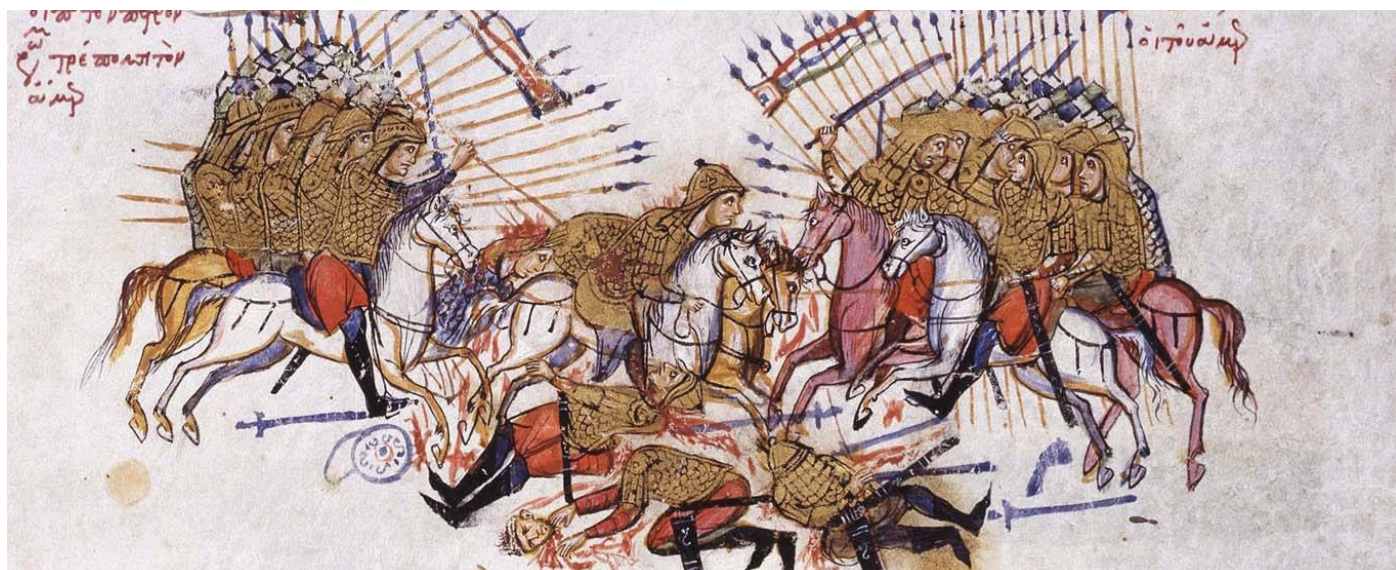
Figuur 2. Afbeelding van conflict tussen Byzantijnse en Arabische soldaten in het Madrid Skylitzes-manuscript (12e eeuw CE)

In navolging van zowel de oude geschriften als de hedendaagse interpretaties worden in de orthodoxe kerk alle vormen van terreur en radicalisme veroordeeld. Geweld wordt beschouwd als "zonde bij uitstek" en kan niet worden aanvaard, "noch als een doel op zich, noch zelfs als een middel om een ander doel te bereiken". Hoewel de kerk accepteert dat er gevallen zijn waarin geweld, als een vorm van zelfverdediging, onvermijdelijk is, maakt ze duidelijk dat het gebruik van geweld het laatste redmiddel moet zijn en nooit buitensporig mag worden. "De kerk verwierpt alle geweld – inclusief defensieve daden – die worden ingegeven door haat, racisme, wraak, egoïsme, economische uitbuiting, nationalisme of persoonlijke glorie. Zulke motieven, die maar al te vaak de verborgen bronnen zijn achter het voeren van zogenaamde 'rechtvaardige oorlogen', worden nooit door God gezegend. Zelfs in die zeldzame situaties waarin het gebruik van geweld niet absoluut verboden is, ziet de Orthodoxe Kerk nog steeds een behoefte aan spirituele en emotionele genezing bij alle betrokkenen."