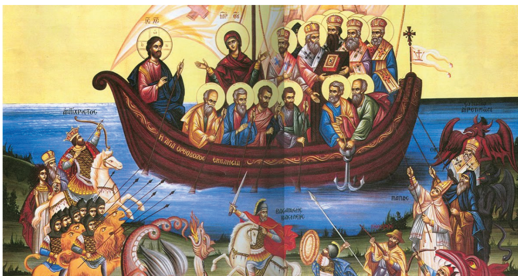
Figuur 4. Een van de iconen die wordt gebruikt voor polarisatiepropaganda door ultraconservatief orthodoxen. De orthodoxe kerk wordt voorgesteld als een schip van heiligen, met Christus als kapitein, terwijl haar vermeende vijanden (waaronder de rooms-katholieke paus, Luther, oecumene, duivels, de "antichrist" en monsters van de Openbaring) tevergeefs proberen haar aan te vallen vanaf de kust.

Polarisatie was in de voorgaande eeuwen een vrij gangbare praktijk in de orthodoxe wereld en was niet alleen gericht op de andere religies, maar ook op de rest van de christelijke belijdenissen. Er is een poging gedaan om deze houding te veranderen sinds het midden van de 20e eeuw, toen de Orthodoxe Kerken officieel begonnen deel te nemen aan vele organisaties van interchristelijke en interreligieuze dialoog (zoals de Wereldraad van Kerken, de Conferentie van Europese Kerken, Religies voor Vrede enz.) "Wetend dat God zich op talloze manieren en met grenzeloze inventiviteit openbaart, gaat de Kerk de dialoog aan met andere religies die bereid zijn om verbaasd en verrukt te zijn door de verscheidenheid en schoonheid van Gods genereuze manifestaties van goddelijke goedheid, genade en wijsheid onder alle volkeren". Een aanzienlijk deel van de ultraconservatieve orthodoxen is echter nog steeds van mening dat communicatie met verschillende bekentenissen en verschillende religies een zonde is en dat veel bisdommen "anti-ketters" afdelingen hebben. Het is dus op de een of andere manier duidelijk dat de twee tendensen, polarisatie en verzoening, nog steeds naast elkaar bestaan en strijdig zijn binnen de orthodoxe wereld, en er is veel te doen in deze richting.