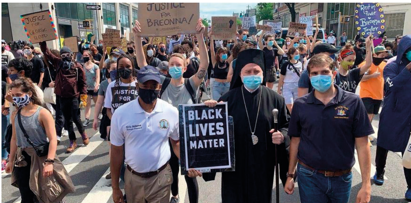
Figuur 3. Elpidophoros, de aartsbisschop van de Orthodoxe Kerk in Amerika, neemt deel aan een Black Lives Matter-demonstratie in het voorjaar van 2020.