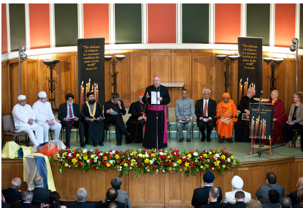
Figure 4. Prière interconfessionnelle pour la paix en 2013 avec des délégués de différentes religions.

Les Églises protestantes participent au dialogue entre chrétiens et avec les autres religions (par exemple, dans le Conseil œcuménique des Églises, le Mouvement de Lausanne, le Parlement des religions du monde). Malgré ces évolutions, de nombreux protestants continuent à mettre l'accent sur les valeurs de la foi et à s'en tenir à certaines «vérités centrales». On peut en voir un exemple dans l'appel lancé dans l'Engagement du Cap lors de la Conférence mondiale de Lausanne sur l'évangélisation (2010) : « Nous affirmons qu'il existe une juste place pour le dialogue avec les personnes d'autres religions, tout comme Paul a engagé le débat avec les Juifs et les non-Juifs dans la synagogue et dans l'arène publique. Dans le cadre légitime de notre mission chrétienne, un tel dialogue associe la confiance dans le caractère unique du Christ et dans la vérité de l'Évangile à une écoute respectueuse des autres. »