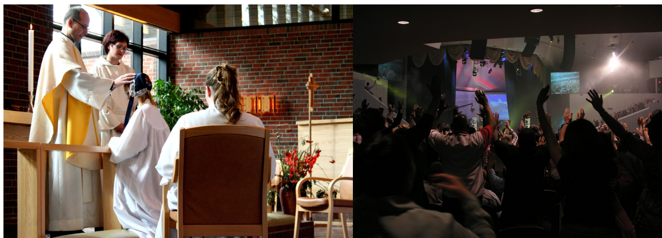
Figure 2. Confirmation luthérienne (gauche) ; service pentecôtiste (droite)

Le protestantisme se caractérise par une diversité intérieure considérable . Bien qu'il existe des similitudes entre les Églises, les mouvements et les dénominations, ils diffèrent par leur forme, leur structure, leur contenu théologique et leur approche des questions controversées. En raison de cette diversité, le protestantisme ne peut être traité comme une entité unique. Différents mouvements peuvent être majoritaires dans un pays ou une région, mais minoritaires autre part. De plus, alors que le christianisme est majoritaire dans de nombreux pays, les protestants sont souvent minoritaires par rapport aux catholiques ou aux orthodoxes.