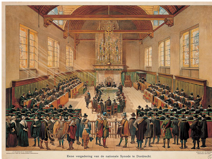
Figure 3. Le synode de Dordrecht en 1618 était une assemblée tenue sur un désaccord théologique au sein de l'église réformée de Basse-Allemagne.

Les Églises protestantes sont affectées par plusieurs développements locaux et mondiaux. Ces développements peuvent être divisés en développements externes et internes. Les développements externes sont les changements dans la société qui posent des défis aux Églises. Dans le contexte européen, ces développements incluent la sécularisation, la migration et le changement climatique. Ils posent des défis théologiques aux Églises et les obligent à examiner des questions fondamentales sur le bien-être de l'église. En même temps, des développements internes ont lieu dans le contexte protestant mondial. Ces développements comprennent un déplacement du centre de gravité du christianisme de l'Europe et des États-Unis vers le Sud global et l'Asie. En outre, d'autres développements ont lieu dans les anciens états coloniaux, tels que l'adaptation de la théologie à la situation post-coloniale et aux traditions indigènes. Ces développements conduisent également à de nombreuses questions et suscitent des débats considérables au sein des Églises protestantes.