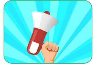
Figure 6.2

Ces libertés sont explicitement protégées par les États démocratiques fondés sur l'État de droit, par exemple à l'article 19 de la Constitution belge et aux articles 9 et 10 de la Convention européenne des droits de l'homme. Concrètement, cela signifie que chaque individu peut exprimer ses convictions sans crainte de persécution.