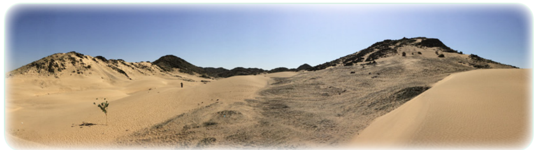
Figure 6.5

Les premières années de la vie du prophète ont été le terreau d'une relation très particulière avec la nature qui allait jouer un rôle constant tout au long de sa mission. Ainsi, le prophète a eu une relation importante avec la nature dès son plus jeune âge. Vivre près de la nature, l'observer, la comprendre et la respecter est nécessaire à une foi profonde. L'univers est plein de signes rappelant la présence du Créateur et le désert ouvre l'esprit humain à l'observation, la méditation et l'initiation. Les premières années de la vie ont sans doute été des années de préparation au cours desquelles son regard était dirigé vers les signes de l'univers.