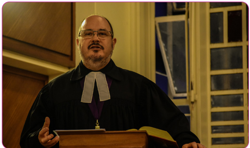
Figure 5.3 Pasteur protestant

Les pasteurs de notre église sont toujours des hommes. Les femmes ne sont pas autorisées à devenir pasteur et ne peuvent donc pas diriger un service religieux. Mon père dit que c'est ce que la Bible nous enseigne. Dans notre église, il y a eu une discussion à ce sujet il y a trois ans et il a été décidé de ne rien changer. Ma sœur faisait partie de ceux qui n'étaient pas d'accord. C'est pour cette raison qu'elle se rend dans une autre église. D'après elle, il n'est pas du tout écrit dans la Bible que les femmes ne devraient jamais prêcher. Elle pense également que cette croyance est dépassée.