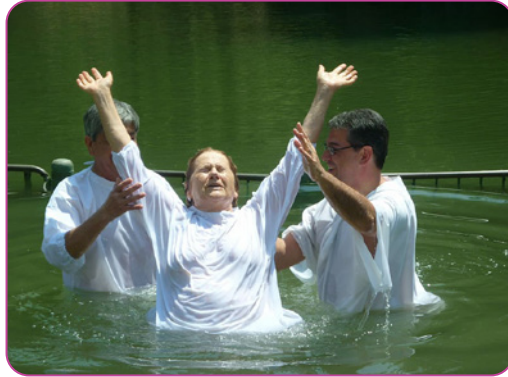
Figure 5.7 Pédobaptême dans une église (à droite)