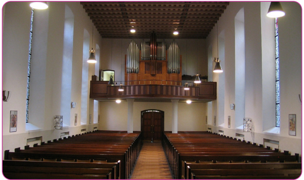
Figure 5.1 Intérieur d'une église luthérienne avec un orgue.