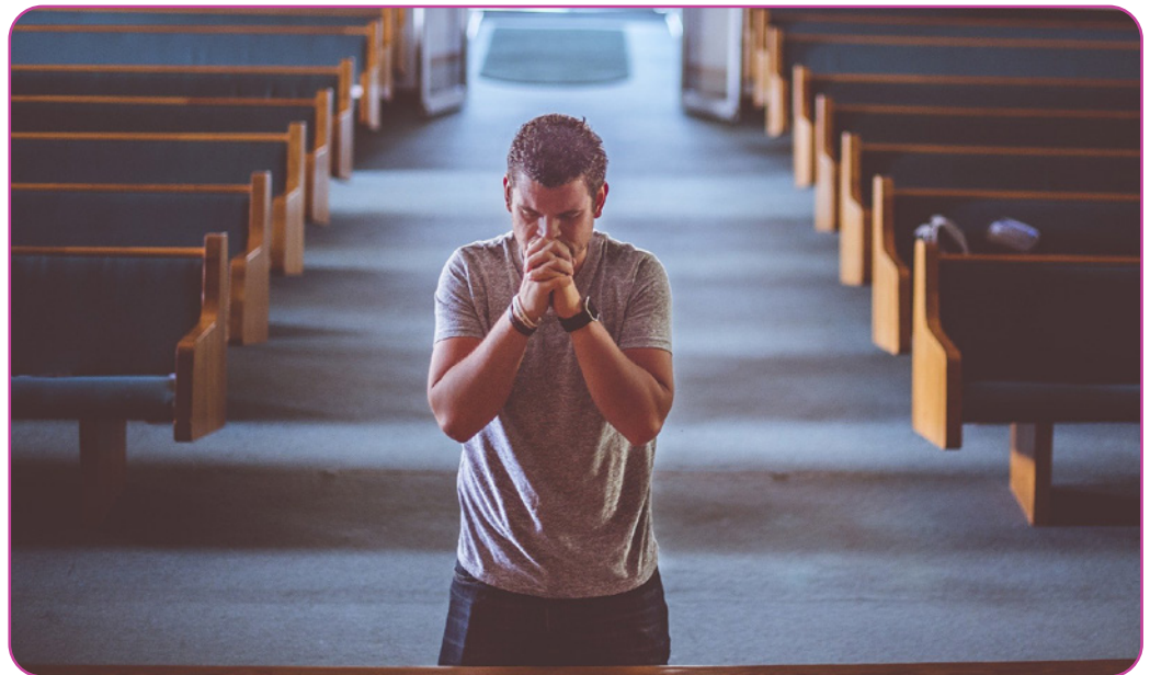
Figure 5.8 Un homme en prière dans une église vide.

À quoi ressemble la foi ou la recherche de sens dans la vie pour vous ?