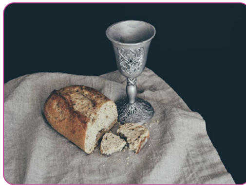
Figure 5.4 Symboles de la Sainte-Cène

Un autre élément de nos services que nous considérons important, c'est la célébration de la Sainte-Cène. Dans certaines églises, elle est encore plus importante que le sermon. Dans mon église, nous la célébrons une fois par mois lors d'un service religieux. La Sainte-Cène implique de se souvenir de ce que Jésus a fait pour nous et elle consiste à manger du pain et à boire du vin. Le pain représente le corps de Jésus et le vin le sang de Jésus. Jésus lui-même a dit que ses disciples devaient le faire régulièrement pour se souvenir de lui. En consommant du pain et du vin, nous nous souvenons que Jésus est mort pour nous sauver.