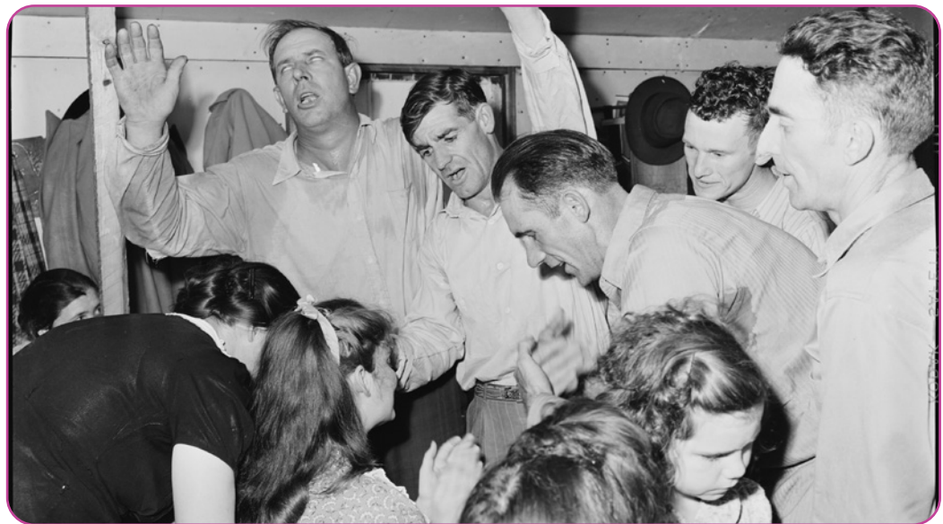
Figure 5.9 Imposition des mains dans l'église de Dieu à Lejunior, Kentucky, le 9 mai 1946

Il convient de parler d'un concept important, le concept de surnaturel . Il se réfère à tout ce qui ne s'inscrit pas dans notre perception commune des lois de la nature. Il s'agit d'un concept très important dans le mouvement pentecôtiste. Vous trouverez ci-dessous une photo en noir et blanc de personnes qui prient pour la guérison divine d'une femme en fauteuil roulant. Tous les protestants ne croient pas nécessairement en un Dieu qui intervient de manière surnaturelle. Certains peuvent croire que les miracles de la Bible étaient surnaturels, mais ils ne croient pas que des événements surnaturels se produisent à notre époque.