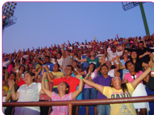
Figure 5.5 Jeunes pentecôtistes louant Dieu lors d'un congrès de jeunes au Mexique.

Pendant des vacances en Amérique du Sud avec mon oncle et ma tante, nous avons visité une église qui était totalement différente de la nôtre. Il y avait beaucoup plus de chant et beaucoup de danse. Ils parlaient aussi avec des sons étranges, que mon oncle a appelé cela « parler en langues ». Ils priaient aussi pour les gens tout en leur imposant les mains. Mon oncle m'a dit que c'était une église pentecôtiste. Il a dit que les pentecôtistes considèrent qu'il est important d'écouter le Saint-Esprit. Le Saint-Esprit est la puissance de Dieu qui agit à travers les hommes. Les protestants croient avec d'autres chrétiens qu'il n'y a qu'un seul Dieu, mais il existe à travers trois personnes, le Père, le Fils et le Saint-Esprit. Je ne comprends pas très bien tout cela, mais on l'appelle « la Trinité ».