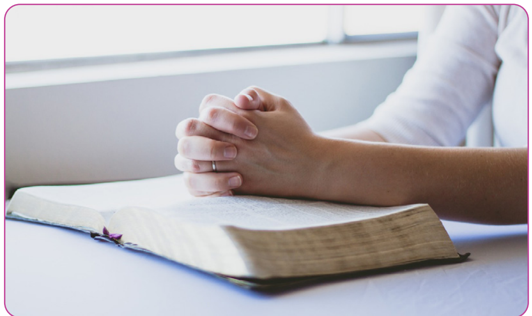
Figure 5.2 La Bible et les mains jointes en signe de prière.

Nos croyances sur Jésus reposent sur les textes de la Bible, qui est un livre sacré pour nous. Pour cette raison, nous lisons chaque jour un extrait de la Bible pendant le dîner. Mes parents se rendent également à l'église chaque semaine pour étudier la Bible. Ils partagent leurs réflexions sur la Bible avec d'autres personnes. Lorsqu'ils rencontrent un problème dans la vie, ils cherchent souvent des conseils dans la Bible, parce qu'ils croient que la Bible est la parole de Dieu. Ma sœur n'est pas d'accord avec ce point de vue. Selon elle, la Bible n'est qu'un livre rédigé par des êtres humains, mais elle peut servir de source précieuse d'inspiration pour la vie.