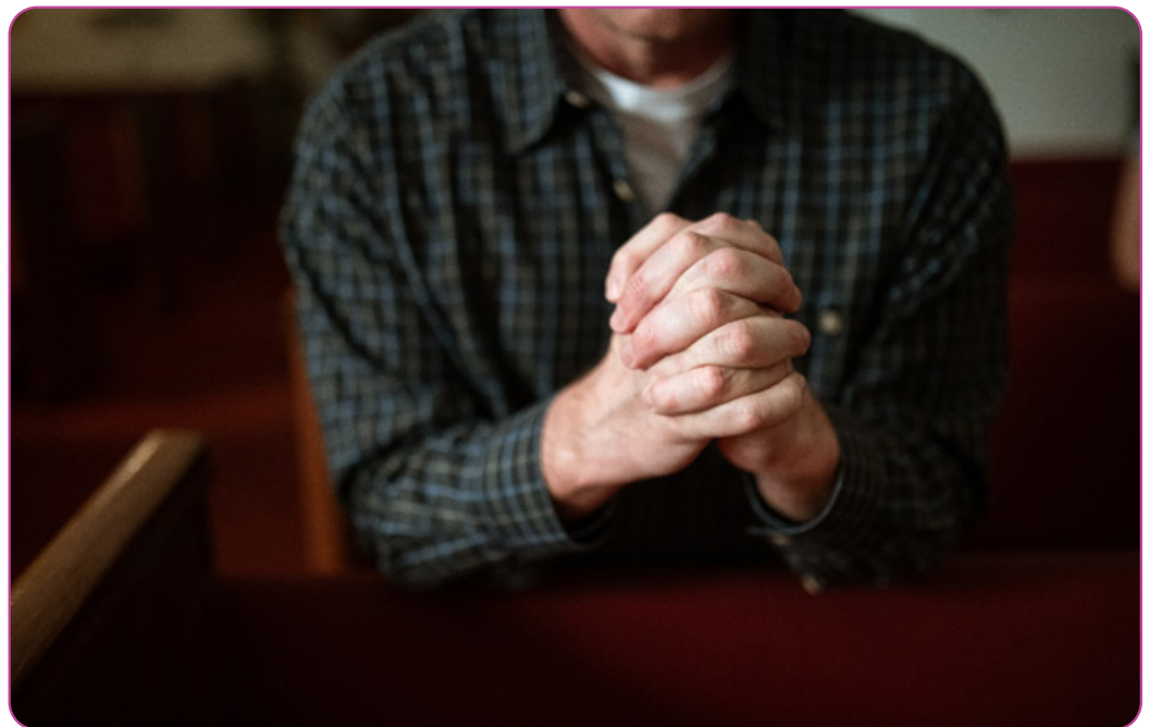
Figuur 2.6 Een persoon die aan het bidden is.

3. Als je zelf niet bidt, begrijp je waarom anderen dit wel doen? Wat zou je aan hen willen vragen?