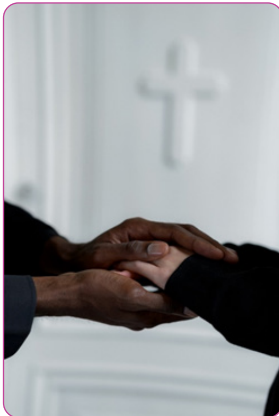
Figuur 2.2 Katholiek gelovigen vinden verbondenheid bij elkaar, bij de Kerkgemeenschap en God.

2. Welke informatie over het katholieke geloof is nieuw voor jou?