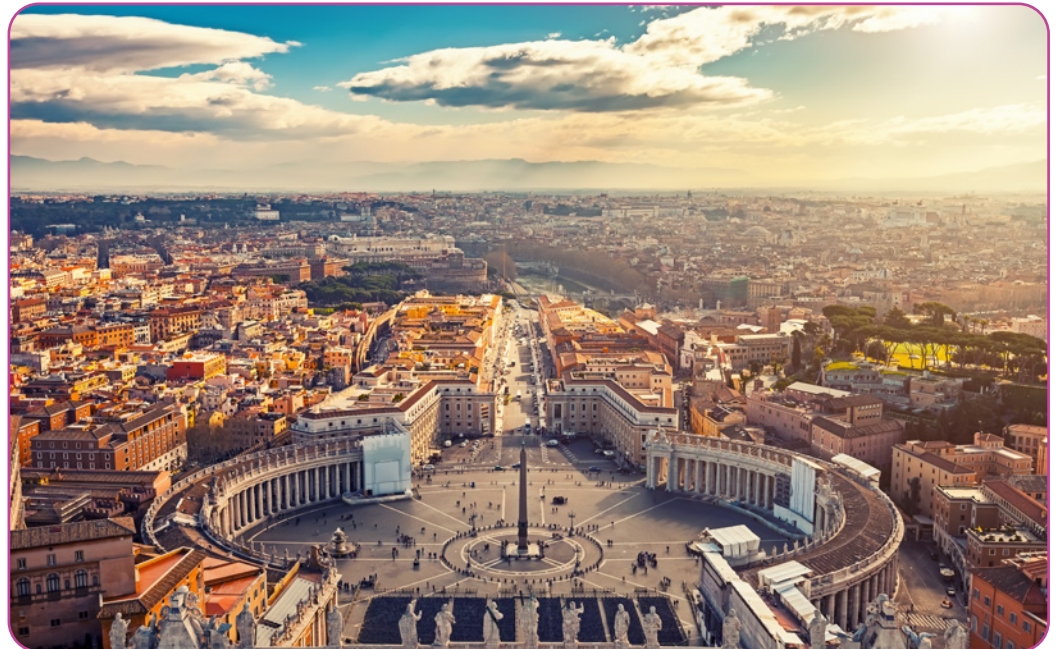
Figuur 2.5 Op de foto zie je het Sint-Pieterplein in Vaticaanstad.