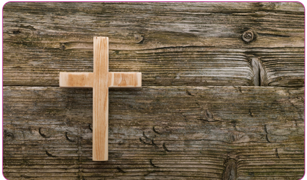
Figuur 2.4 Een kruis is één van de belangrijkste symbolen voor katholieken

2. Een katholiek gelovige die op bedevaart gaat, maakt een inspirerende reis naar een plaats met een belangrijke religieuze betekenis. Katholieken kunnen ervoor kiezen om op bedevaart te gaan naar plaatsen die met heiligen zijn verbonden, zoals Lourdes.