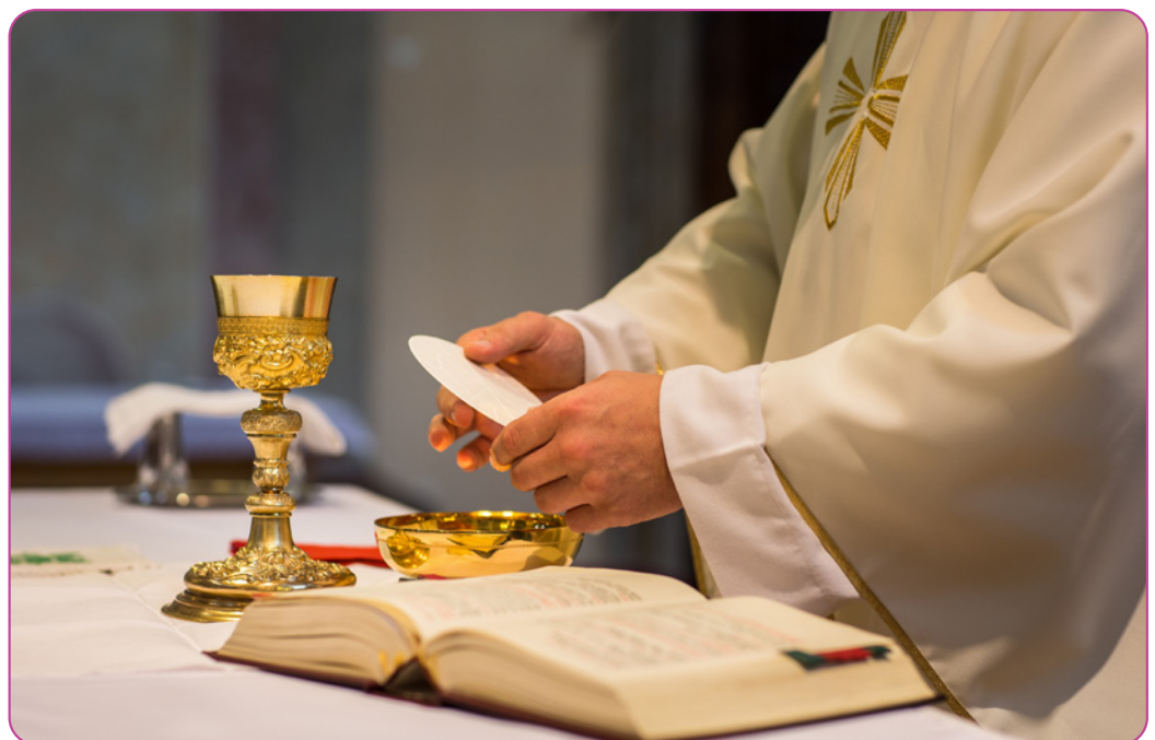
Figuur 2.3 Het moment van de eucharistie tijdens een viering in de kerk.