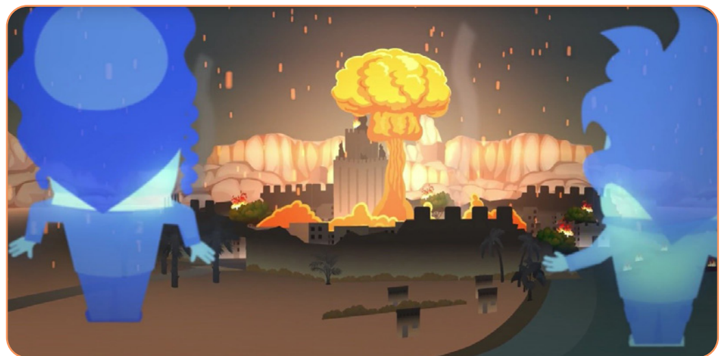
Afbeelding 1.2 De videoclip