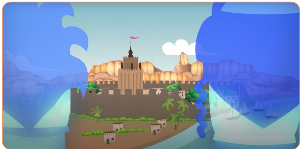
Afbeelding 1.1. De videoclip

Aarons reden om niet te helpen heeft met een eigenaardig Thoraverhaal te maken: de vernietiging van Sodom en Gomorra. Het afbranden van het appartementsblok is net als het afbranden van Sodom en Gomorra een straf van G-d. Levi, een joodse medestudent, twijfelt aan Aarons interpretatie. Samen worden ze in het verhaal gezogen, en moeten ze opzoek naar de betekenis van het verhaal.