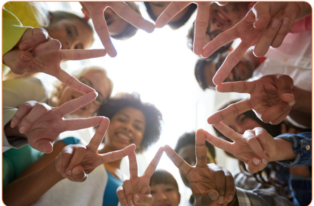
Afbeelding 4.2