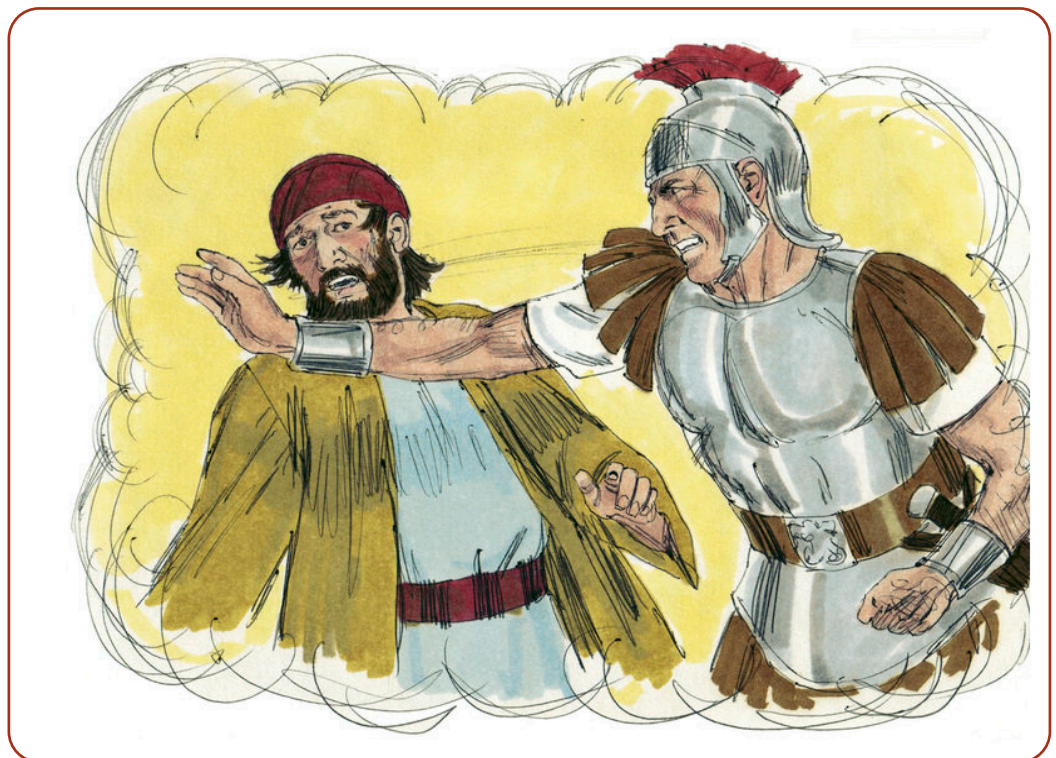
Afbeelding 4.2 Weergave van een slag op de wang, 1984. Bron: Jim Padgett, met dank aan de Sweet Publishing, Ft. Worth, TX, en Gospel Light, Ventura, CA via Wikimedia Commons. Dit bestand is gelicenseerd onder de Creative Commons Naamsvermelding-Gelijk delen 3.0 Unported . Geen wijzigingen in het werk zijn aangebracht. https:// commons.wikimedia.org/ wiki/File:Gospel_of_Luke_ Chapter_6-15_(Bible_ Illustrations_by_Sweet_ Media).jpg

Ik zag dat het beest en de koningen op aarde zich met hun troepen hadden verzameld om oorlog te voeren met de ruiter op het paard en zijn legermacht.