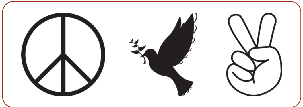
Afbeelding 4.5 Verschillende symbolen van vrede.