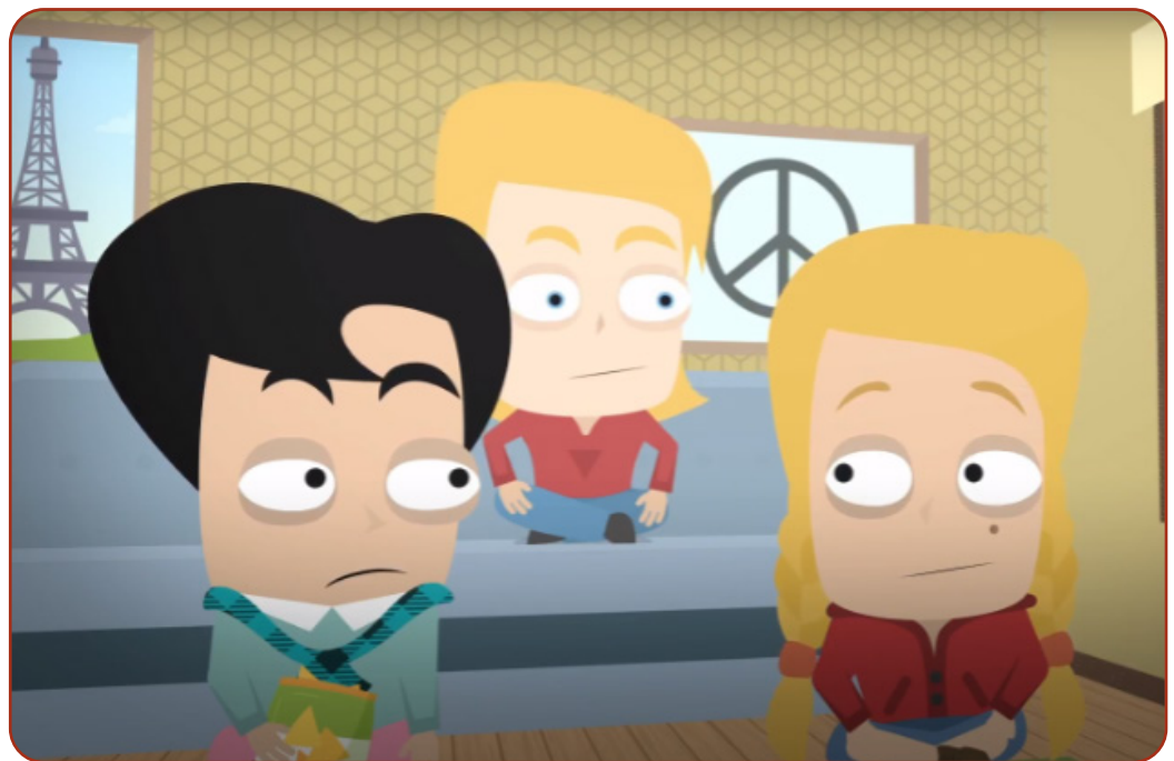
Afbeelding 4.1 Scene uit de video

1. 'TUSSEN VREDE EN GEWELD' (LUKAS 6:27-35; OPENBARINGEN 19:26-32): VIDEO