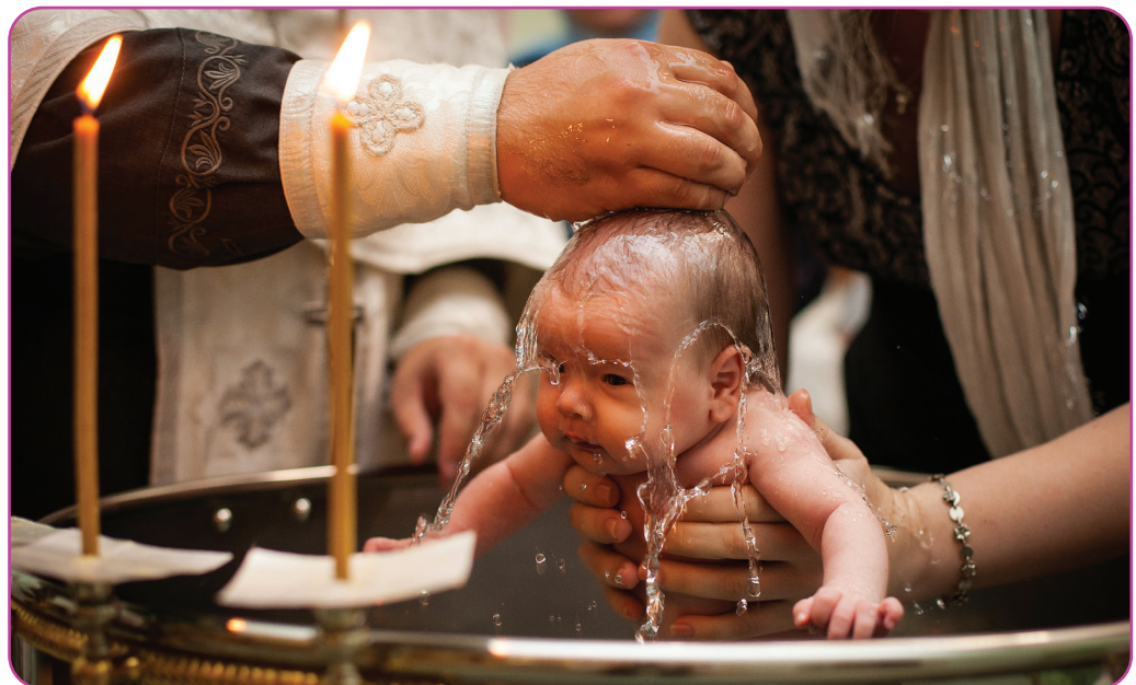
Figuur 4.5 Pasgeboren baby doop in Heilig water

gedoopt, worden kinderen tegenwoordig in de Orthodoxe Kerk meestal in de eerste maanden van hun leven gedoopt. De doop wordt verricht door de priester. De peetouders van mijn zuster, die binnenkort gedoopt zal worden, zullen er zijn om te helpen. Zij zullen haar spirituele ouders zijn en verantwoordelijk voor haar opgroeien volgens de leringen van de orthodoxe kerk. Mijn zus zal Sophia heten, naar een van mijn grootmoeders. Tijdens de ceremonie zal de priester mijn zus drie keer onderdompelen in het water van de doopvont in de naam van de Vader, de Zoon en de Heilige Geest. Dit is een symbool van sterven en herboren worden in een nieuw leven naar het voorbeeld van Jezus Christus die stierf en opstond uit de dood. Geen wonder dat dit een belangrijke dag in ons gezin is. Na de ceremonie zullen we het vieren met een groot diner en muziek en mijn gelukkige zusje zal een heleboel cadeautjes krijgen!