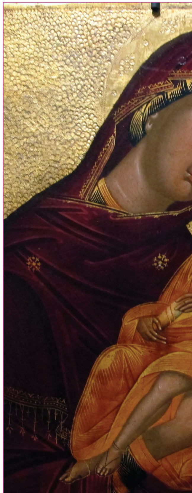
Figuur 4.6. De Theotokos in de gestalte van Glykofilousa (die Genève: "Creta o venezia, madona glykophilousa, 1457.JPG", madonna_glykophilousa_1457.JPG )

Wit: Het staat voor zuiverheid en goddelijkheid. Dit is de kleur van de kleding van de engelen en Jezus als het doel is zijn goddelijke natuur te benadrukken als de Zoon van God.