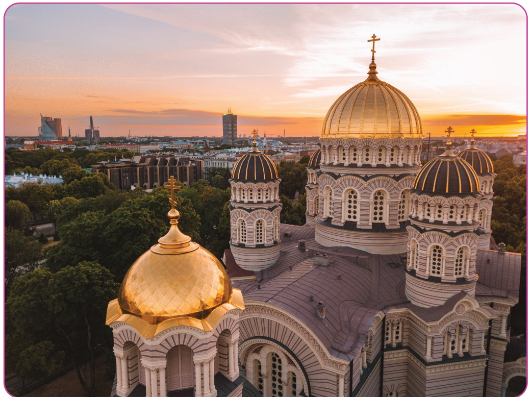
Figuur 4.1 Kathedraal van de Geboorte van Christus in Riga, Letland