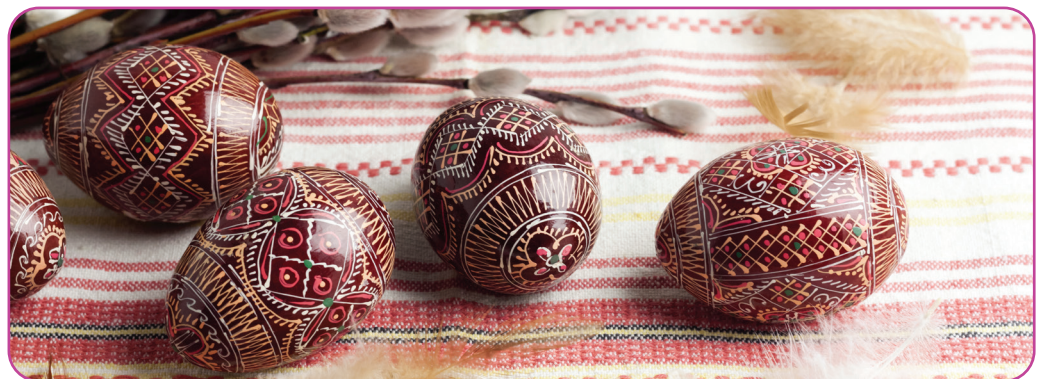
Figuur 4.2 Versierde paaseieren, traditioneel voor de Oost- Europese cultuur

De Orthodoxe Kerk kent vele feesten die het hele jaar door worden gevierd. Sommige feesten hebben vaste dagen in het jaar en andere, die elk jaar op een andere datum gevierd worden, worden verplaatsbare feesten genoemd. In de periode voor de grote feesten wordt gewoonlijk gevast, wat betekent dat men bepaalde soorten voedsel niet eet, zoals melk en vleesproducten. Er zijn ook twee vaste vastendagen in de week, woensdag en vrijdag, wanneer we Jezus' dood aan het kruis gedenken.