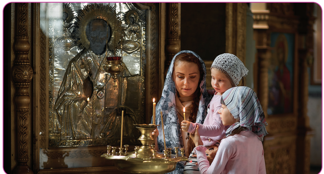
Figuur 4.7 Jonge moeder en haar kleine blonde Kaukasische dochter met kaarsen in orthodoxe Russische Kerk