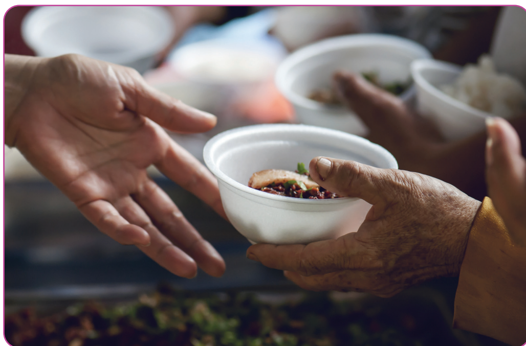
Figuur 4.8 Handen van de armen ontvangen voedsel

Welke verbanden zou je met de huidige situaties en uitdagingen kunnen leggen?