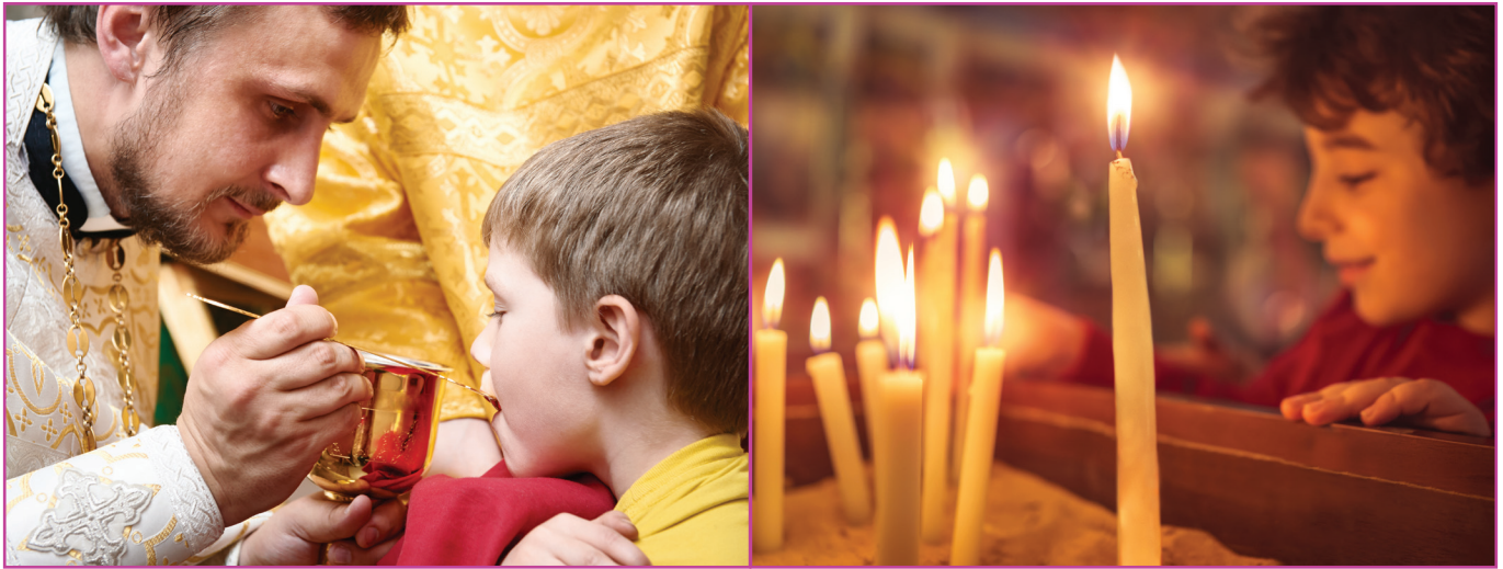
Figuur 4.3 Orthodoxe ceremonie van de Eucharistie