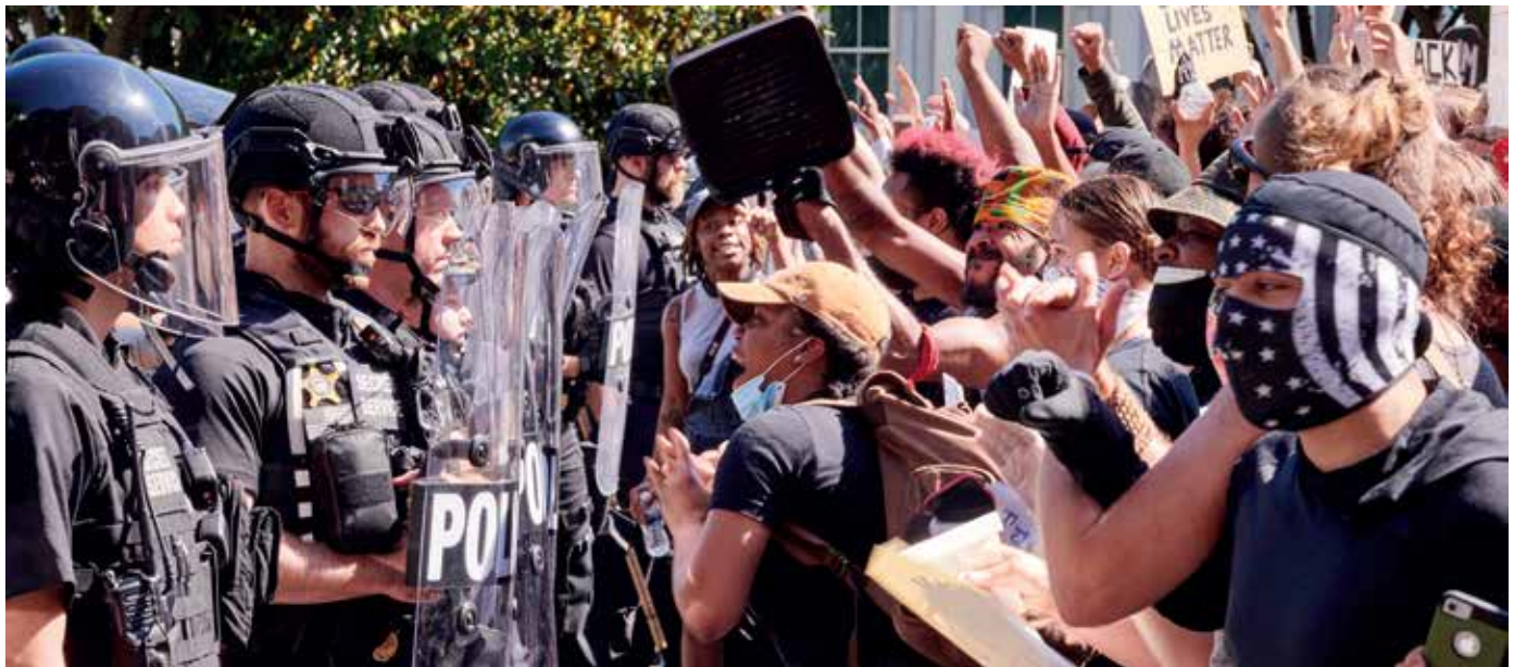
Figure 4: George Floyd manifestation près de la Maison Blanche.

Dans une société pluraliste, nous avons des visions différentes de l'éthique ; deux cultures peuvent avoir des valeurs différentes de même qu'il peut y avoir deux solutions différentes à un même problème. Dans le même temps, deux cultures peuvent avoir la même valeur mais fondée sur des justifications différentes. La polarisation se produit lorsque nous sommes d'accord sur les valeurs mais en désaccord sur les raisons.