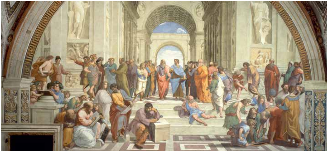
Figure 1: Ecole d'Athènes de Raphael, Vatican.

L'éthique est le fondement de notre relation avec le monde qui nous entoure et avec nous-mêmes. Elle nous permet de vivre ensemble et nous fournit des idéaux pour développer notre caractère afin que nous puissions nous épanouir en tant qu'êtres humains.