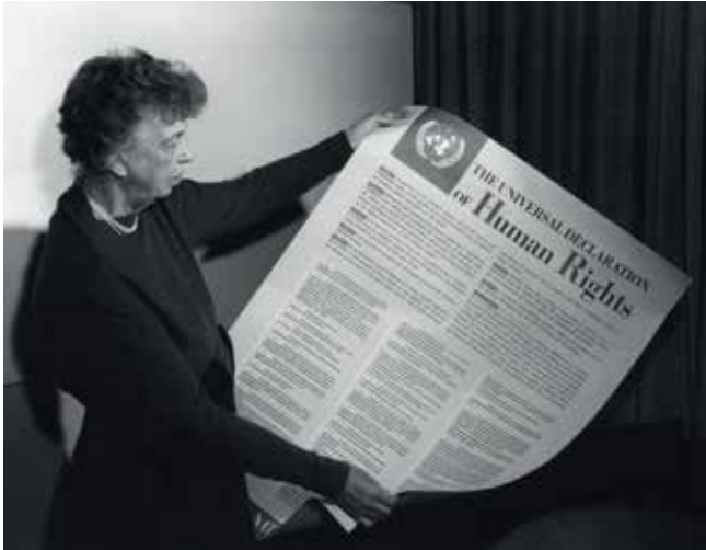
Figure 2: Eleanor Roosevelt tenant une affiche de la Déclaration universelle des droits de l'homme, New York. Novembre 1949.