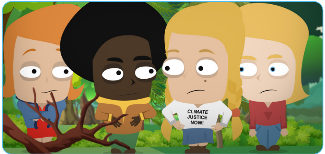
Figure 3.1 Video Clip