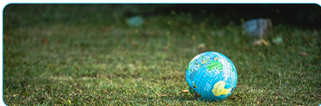
Figure 3.1

Ce manuel fait une distinction entre « matière de base » et « matière avancée ». La matière de base est traitée de manière standard dans le manuel destiné aux élèves et occupe une heure de cours. L'enseignant peut également choisir d'approfondir les connaissances des élèves en utilisant des chapitres supplémentaires avec les impulsions correspondantes et les suggestions didactiques, qui sont également fournies dans ce manuel.