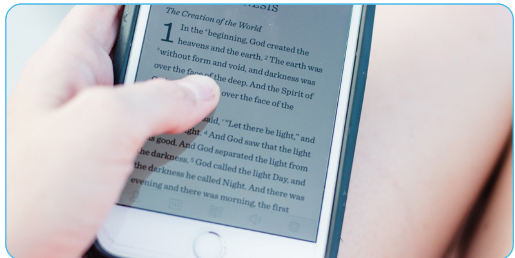
Figure 3.4

Dans une lecture symbolique des récits bibliques, le contexte d'origine est important, mais aussi le contexte contemporain dans lequel l'histoire est lue. C'est ce qu'on appelle aussi la recontextualisation . Dans ce processus de recontextualisation, des aspects de la foi chrétienne, tels que les récits bibliques, sont examinés à travers des lunettes contemporaines dans lesquelles l'interaction entre le texte et le contexte peut conduire à de nouvelles possibilités d'interprétation.