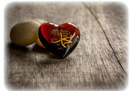
Figure 6.3

Ils croyaient que les Bédouins vivaient une vie plus libre et plus saine que ceux qui vivaient dans la ville. Pour réussir sa vie dans le désert, il faut un haut niveau de solidarité et, par conséquent, un haut niveau de respect de la personnalité et d'appréciation de la valeur humaine.