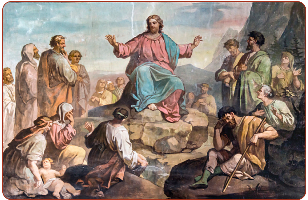
Figure 3.3 Peinture Le Sermon sur la montagne par Arsène Robert, 1870 Source: Didier Descouens via Wikimedia Commons. Ce fichier est sous la licence Creative Commons Attribution - Partage dans les Mêmes Conditions 4.0 International . Aucune modification a été faite. https://commons.wikimedia.org/wiki/File:Église_Saint-Martin_de_Castelnau-d%27Estrétefonds_-_Le_Sermon_sur_la_montagne_par_Robert_Arsène_IM31000073.jpg

Dans la deuxième partie (12), Jésus parle de la façon dont les gens doivent traiter les autres. La première partie sert à montrer une relation entre les leçons précédentes du Sermon sur la montagne et ce qu'on appelle la Règle d'Or dans cette deuxième partie. Cette relation peut être considérée comme une conclusion de toutes les actions qu'une personne doit réaliser dans la vie. Avant ce texte, la Règle d'or était souvent formulée comme suit : « Ce qui vous est haïssable, ne le faites pas à votre prochain. » Jésus utilise une formulation positive afin de souligner qu'une personne doit faire quelque chose vis-à-vis des autres, au lieu d'une formulation négative qui implique de ne pas faire quelque chose aux autres. Jésus montre que tout comme Dieu offre sa bonté à l'humanité, ses disciples doivent apprendre qu'ils ont besoin de vivre dans la bonté avec les autres.