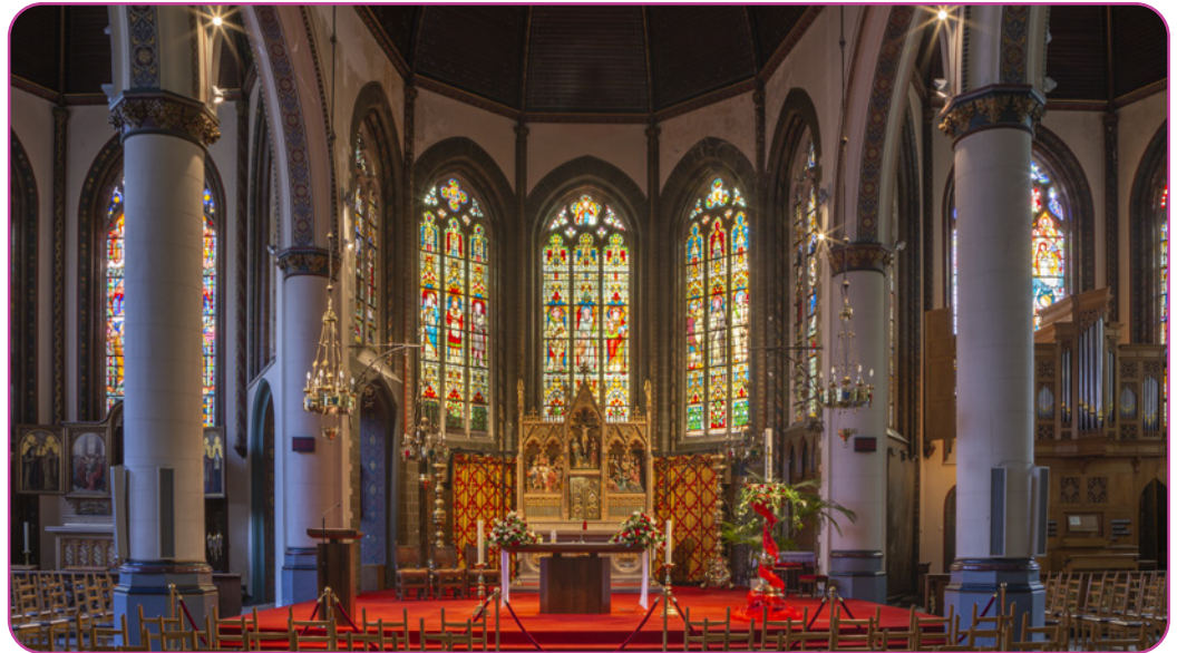
Figuur 2.1 Kerkgebouwen zijn de gebedshuizen voor katholieken. Op de foto zie je de Sint-Gilliskerk van Brugge, in België.