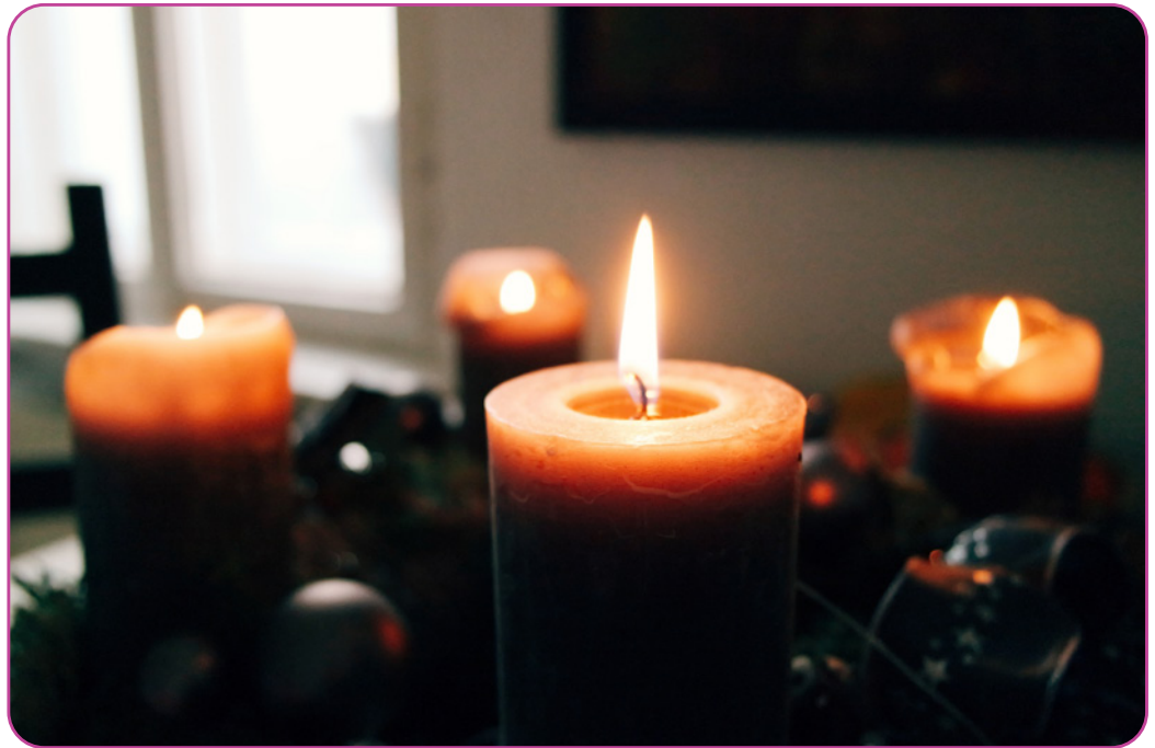
Figuur 2.3 Een adventskrans

De eerste zondag van de adventsperiode markeert het begin van het liturgisch jaar binnen de Katholieke Kerk. De advent is de periode voorafgaand aan Kerstmis. Het is de voorbereiding op Kerstmis , waarbij christenen uitkijken naar de komst van Jezus. Tijdens de adventsperiode, de vier weken die aan Kerstmis voorafgaan, versieren christenen een krans. Deze adventskrans wordt versierd met vier kaarsen. Iedere zondag van de adventsperiode wordt een nieuwe kaars aangestoken om af te tellen naar de geboorte van Jezus Christus.