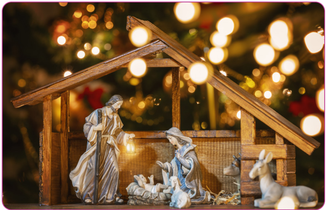
Figuur 2.4 Een kerststal

De Kersttijd wordt afgesloten met Driekoningen . Dit wordt jaarlijks gevierd op 6 januari. Met Driekoningen herdenken gelovigen de 'wijzen uit het oosten' die een ster volgden op zoek naar 'de pasgeboren koning der Joden', en geschenken voor de pasgeboren Jezus meebrachten.