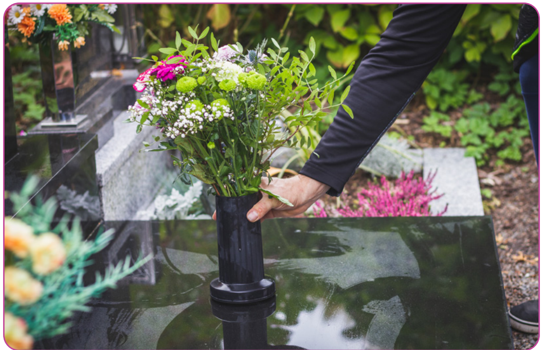
Figuur 2.7 Met Allerheiligen en Allerzielen bezoeken christenen het kerkhof ter nagedachtenis van alle overledenen.

Op de laatste zondag van het liturgisch jaar vieren gelovigen het feest van Christus Koning , dit feest betekent het einde van het liturgisch jaar. De adventsperiode, het begin van een nieuw liturgisch jaar, start een week later.