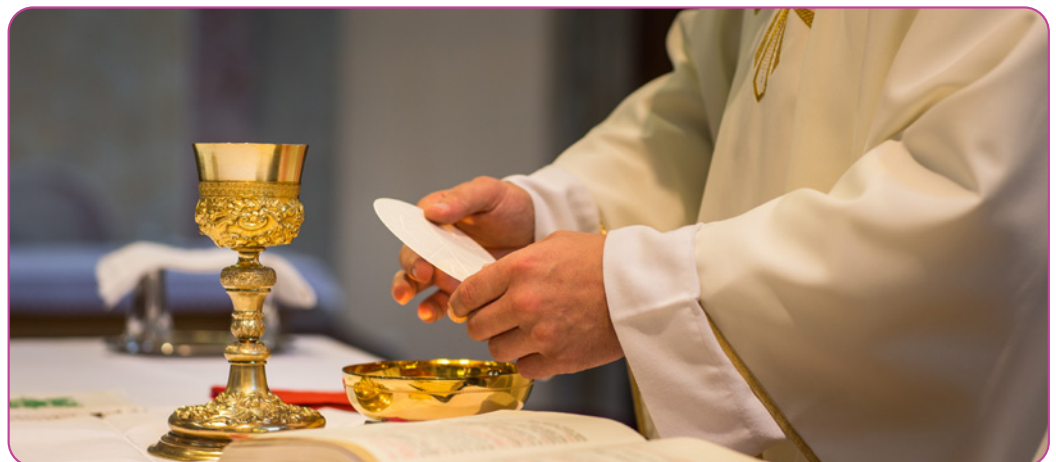
Figuur 2.2 Het moment van de eucharistie tijdens een viering in de kerk.