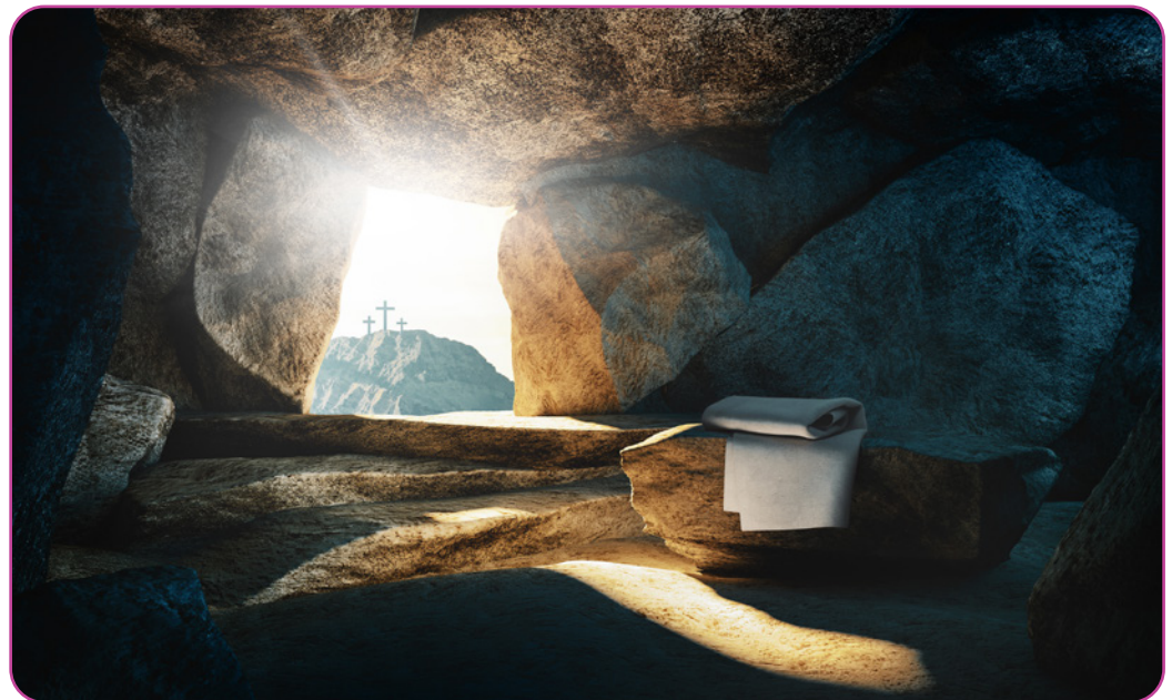
Figuur 2.6 Met Pasen vieren christenen de verrijzenis van Jezus.

Veertig dagen na Pasen vieren christenen Hemelvaartsdag. Met Hemelvaart herdenken gelovigen dat Jezus na zijn verrijzenis wordt opgenomen in de hemel, bij God de Vader. Net zoals Hemelvaart op die manier samenhangt met Pasen, wordt ook het feest van Pinksteren verbonden met het Paasverhaal. Pinksteren valt tien dagen later dan Hemelvaart, of vijftig dagen na Pasen. Op deze dag herdenken christenen het neerdalen van de Heilige Geest. Met Pinksteren herdenken christenen dat Jezus hen niet in de steek liet na Hemelvaart, integendeel, Jezus kondigde de komst van de Geest zelf aan. Dit brengt ons ook bij het begrip van de Heilige Drievuldigheid, christenen spreken met name steeds over God in drievoud: God de Vader, Jezus Christus de Zoon en de Heilige Geest.