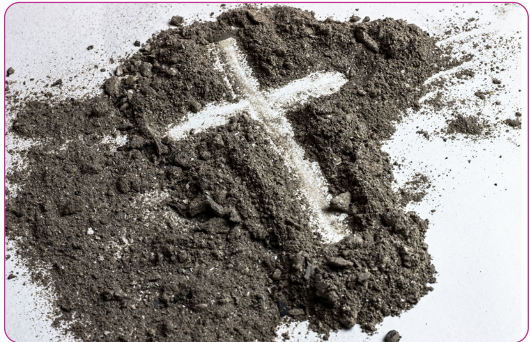
Figuur 2.5 Op Aswoensdag ontvangen gelovigen een askruisje.

De laatste week voor Pasen noemen christenen de Goede Week . De Goede Week vangt aan met Palmzondag, dan herdenken gelovigen het verhaal van de intocht van Jezus in Jeruzalem. De dag voor de kruisdood van Jezus vieren christenen Witte Donderdag, waarop Jezus met zijn leerlingen het Laatste Avondmaal deelde. Op Goede Vrijdag herdenken christenen vervolgens het lijden en sterven van Jezus. Jezus stierf voor de zonden van alle mensen. Stille zaterdag is de dag voor Pasen, waarop christenen stilstaan bij de dood van Jezus. En op zondag vieren christenen Pasen.