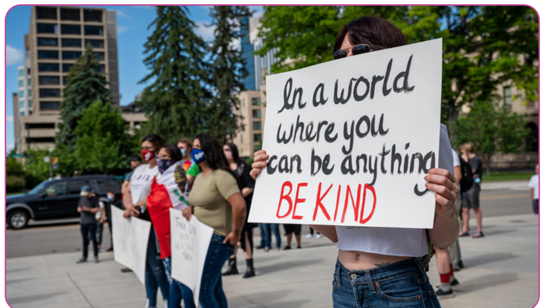
Figuur 6.6 Onbekende social justice warrior met een bord tijdens een manifestatie op straat