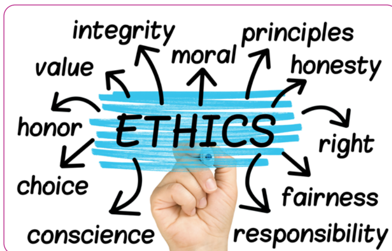
Figuur 6.10 Ethiek Woordwolk in het Engels

Filosofie met kinderen: filosofie voor/met kinderen duidt in de eerste plaats op een reeks methoden die is ontworpen om kritisch denken en reflectief begrip bij kinderen aan te moedigen en te cultiveren. De nadruk ligt op kritisch denken, d.w.z. denken dat gebaseerd is op het gebruik van de rede, op passende wijze geleid wordt door (goede) redenen in tegenstelling tot bijv. ongeïnformeerde verlangens en neigingen, vooroordelen en angsten, en een persoon helpt vragen te beantwoorden over wat te geloven en wat te doen.