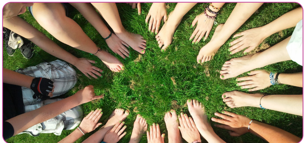
Figuur 6.7

Er zijn ook voorstellen dat de ethische theorie zelf de basis is waarop ethiekonderwijs gericht moet zijn. Warnick en Silverman merken op: “Een andere manier om naar ethiekonderwijs te kijken – een favoriet onder traditionele filosofen – is om beroepsethiekonderwijs te zien als een gelegenheid om iets over filosofische theorieën van ethiek te leren. Bij deze benadering worden de leerlingen onderwezen in een of meerdere ethische theorieën (meestal utilitarisme, Kantiaanse deontologie of zorgethiek) en wordt hen vervolgens geleerd deze theorieën toe te passen om ethische dilemma’s op te lossen, of op zijn minst zich daarover te informeren” (2011, 274).