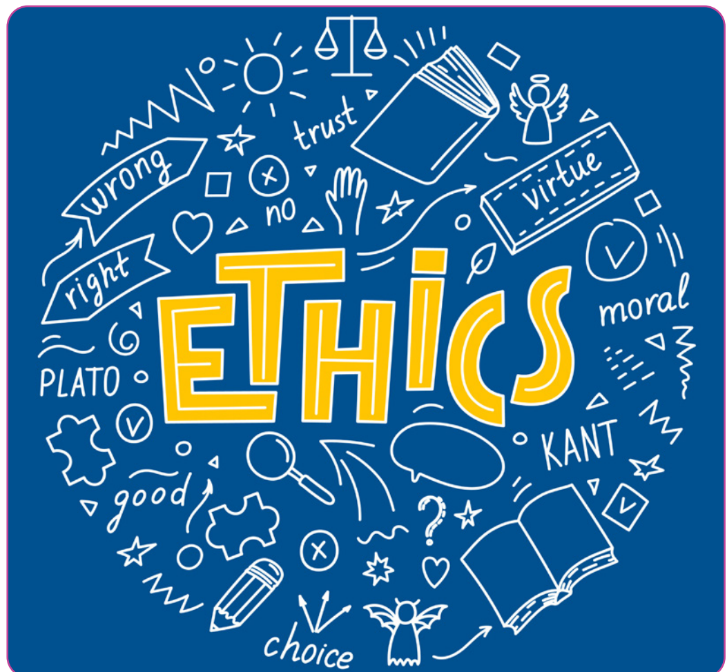
Figuur 6.3 Getekende droedels rond het woord 'ethiek' in het Engels

Ethische beginselen en regels vormen een belangrijk onderdeel van de ethiek en de naleving ervan beschermt de voorwaarden van het menselijk bestaan en de gemeenschappelijke menselijkheid. Morele beginselen zijn meestal algemener (bijv. "Respecteer de vrijheid, autonomie en gelijkheid van mensen"), morele regels zijn specifiek (bijv. "Lieg niet"). Morele principes en regels kunnen op verschillende manieren worden opgevat. De meest fundamentele is de opvatting van morele beginselen als morele criteria of normen. Op die manier geven beginselen en regels de ethische criteria aan voor ons gedrag en de beoordeling van dat gedrag; zij bepalen wat goed is en wat fout. Dichter bij de alledaagse moraal staat een andere manier om morele principes en regels te begrijpen, namelijk als gidsen bij onze besluitvorming en ons handelen. Ze zijn waardevol omdat ze kunnen dienen als betrouwbare leidraad voor wat we moeten doen.