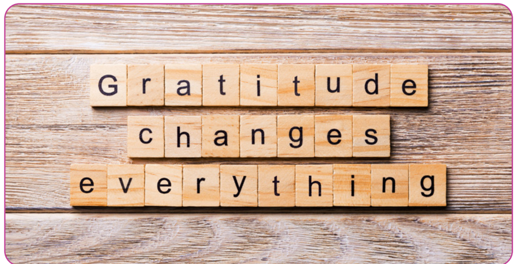
Figuur 6.5 'Gratitude changes everything' geschreven op houten blokken ('dankbaarheid verandert alles')

Deugden zijn moreel belangrijke kwaliteiten, disposities voor actie of persoonlijkheidskenmerken van mensen. Zij houden nauw verband met het menselijk karakter en kunnen worden opgevat als uitmuntendheden. Het tegenovergestelde van deugden zijn ondeugden, gebreken of tekortkomingen. Morele deugden zijn bijvoorbeeld eerlijkheid, vriendelijkheid, medeleven, hoffelijkheid, vrijgevigheid, enz. Deugden omvatten verschillende componenten, namelijk cognitief, emotioneel, motiverend en actiegericht. Moreel juist zijn die handelingen die het resultaat zijn van of voortkomen uit ons deugdzame karakter. Plato en Aristoteles zijn de grondleggers van de deugdethiek.