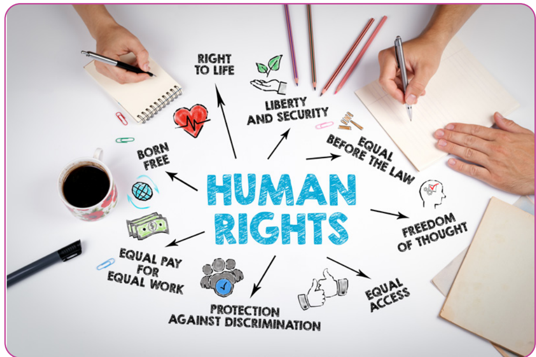
Figuur 6.4 Het concept 'mensenrechten' in het Engels

Waardigheid is om deze reden ook een gangbaar begrip in zeer belangrijke juridische documenten. De Universele Verklaring van de Rechten van de Mens (VN 1948) bouwt op de volgende openingsverklaring: “Overwegende dat erkenning van de inherente waardigheid en van de gelijke en onvervreembare rechten van alle leden van de mensengemeenschap de grondslag is voor vrijheid, gerechtigheid en vrede in de wereld”. In artikel 1 staat: “Alle mensen worden vrij en gelijk in waardigheid en rechten geboren. Zij zijn begiftigd met verstand en geweten, en behoren zich jegens elkander in een geest van broederschap te gedragen”. Ook in het Handvest van de grondrechten van de Europese Unie (EU 2012) wordt in de preambule de waardigheid genoemd als de grondslag van alle mensenrechten: “De volkeren van Europa hebben besloten een op gemeenschappelijke waarden gegrondveste vreedzame toekomst te delen door onderling een steeds hechter verbond tot stand te brengen. De Unie, die zich bewust is van haar geestelijke en morele erfgoed, heeft haar grondslag in de ondeelbare en universele waarden van menselijke waardigheid en van vrijheid, gelijkheid en solidariteit. Zij berust op het beginsel van democratie en het beginsel van de rechtsstaat”. Het eerste artikel luidt: “Menselijke waardigheid: De menselijke waardigheid is onschendbaar. Zij moet worden geëerbiedigd en beschermd”.