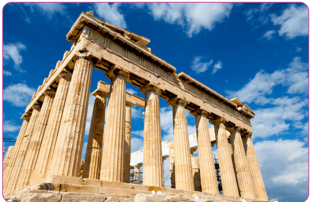
Figuur 6.2 Foto van het Parthenon

De term “ethiek” komt van het Griekse woord “ēthikós”, een variant van “ēthos.” Het verwijst in de eerste plaats naar ons moreel karakter, d.w.z. naar de personen die we zijn of die we willen zijn. Een andere term voor ethiek is “moraliteit” en we gebruiken deze term als we stellen dat iemand iets moreel juist of moreel goed gedaan heeft. Ethiek vormt de basis van onze relatie met de wereld om ons heen en met onszelf. Het doel en de rol van ethiek is altijd gericht geweest op de mens als persoon, de menselijke waardigheid, en de voorwaarden voor het leiden van een goed leven. De huidige cultuur waarin wij leven wordt sterk gekenmerkt door pluralisme. In de crises en onrust die we meemaken moeten we rekening houden met de toenemende onderlinge verbondenheid van de wereld (globalisering) en onze afhankelijkheid van elkaar. Onze culturen worden ook vaak gekenmerkt door de “relativering” van waarden, wat in wezen een uiting is van een verminderd vertrouwen in de samenleving en in de gekende antwoorden op fundamentele bestaansvragen. Ethiek beschermt en ondersteunt het mens-zijn van ons bestaan, zowel in onszelf als in anderen. Wij leven altijd in relatie met anderen, in een relatie van wederzijds geven en ontvangen. Daarom is de erkenning van onze afhankelijkheid van anderen en de zorg voor anderen van essentieel belang voor ethisch denken (Ethics education resources, 2021).