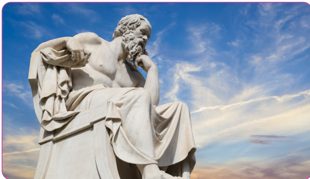
Figuur 6.9 Beeld van Socrates in de Academie van Athene, Griekenland