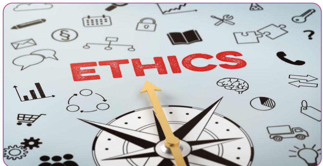
Figuur 6.1 Ethisch kompas

Dit onderdeel van de Shallow Module beoogt een introductie te bieden in ethische basisbegrippen en ethische theorieën als basis voor een klasdiscussie over niet-confessionele ethiek. Een dergelijke presentatie van ethiek als onderdeel van de cursus over levensbeschouwing en het voorkomen van polarisatie en radicalisering belicht universele ethische grondbeginselen die worden gebaseerd op het idee van een gedeelde menselijkheid. In de video zijn enkele concrete voorbeelden, toepassingen en domeinen van de ethiek opgenomen om de inhoud voor de leerlingen toegankelijk te maken en hen te stimuleren. De nadruk ligt daarbij op een niet-religieuze of atheïstische kijk op het leven. In dit gedeelte van deze Shallow module van het tekstboek ligt de nadruk op ethiek. Op die manier dient het ook als aanvulling op de vier “Ethiek”- Deep Modules : het vult de daar behandelde onderwerpen aan en biedt een breder perspectief op de vraagstukken, die daar aan de orde gesteld zijn.