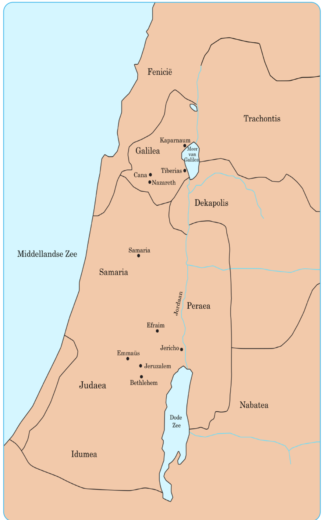
Figuur 1.3 Judea in de eerste eeuw