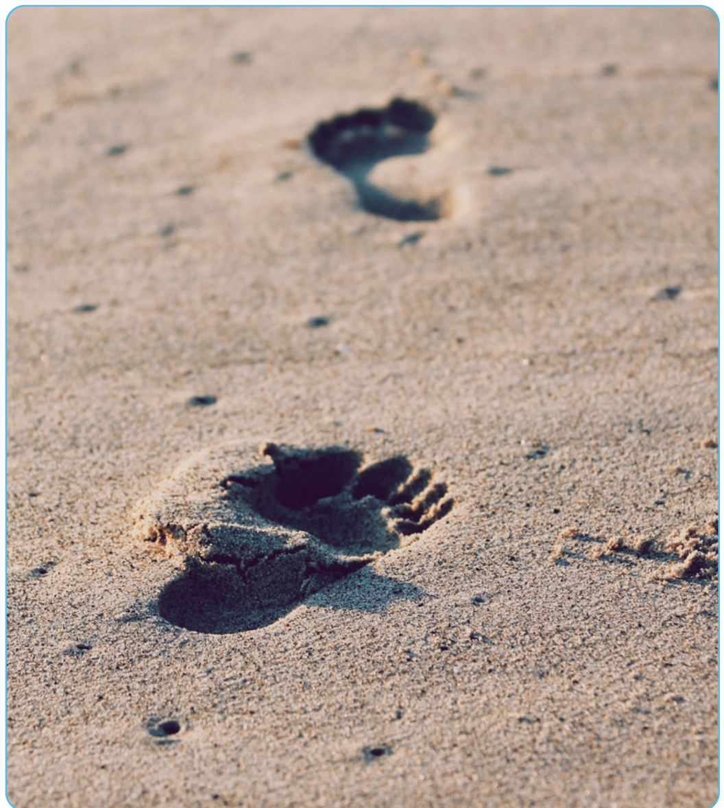
Figuur 1.4 Voetstappen

Om de Bijbel en het leven van Jezus beter te begrijpen, is het belangrijk om te weten dat Jezus opgroeide, leefde en predikte in deze joodse context. Het religieuze leven was van groot belang in Palestina, en dus ook in Galilea. Jezus en zijn omgeving werden sterk beïnvloed door de Joodse Schrift en traditie. Jezus was dus zelf ook joods. Elke gebeurtenis, van de wieg tot in het graf, stond in het teken van de joodse traditie. De tempel in Jeruzalem vormde toen het hart van het jodendom: alle vrome joden kwamen er bidden en offeren, ook Jezus kwam hier regelmatig. Jeruzalem was de hoofdstad/ het centrum van Palestina.