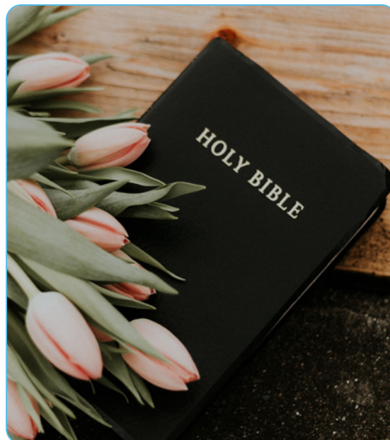
Figuur 1.5 Heilige Bijbel

Deze vraag was een belangrijke discussie ten tijde dat Marcus zijn evangelie schreef. In deze context moet de ontmoeting tussen Jezus en de Syrofenicische vrouw, een heiden, gelezen worden.