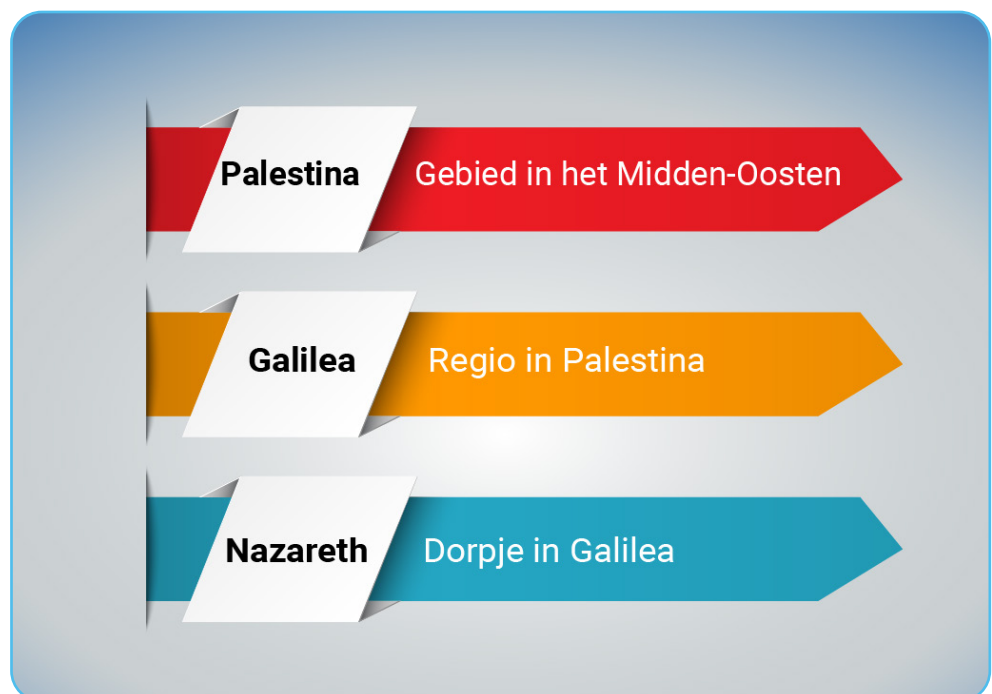
Figuur 1.2 Jezus' omgeving

In het verhaal van 'Jezus en de Syrofenicische vrouw' lezen we dat Jezus verbleef in de buurt van de stad Tyrus . Tyrus was toen een havenstadje aan de kust van de Middellandse Zee. De stad lag buiten de grenzen van het toenmalige Palestina. Het was een van de belangrijkste steden van de kleine kuststaat Fenicië .