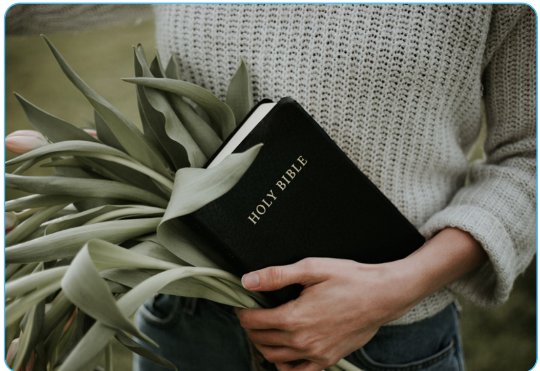
Figuur 1.6 Heilige Bijbel

Verder is het ook opmerkelijk dat het Jezus is die van mening verandert. In de meeste evangeliëverhalen is het Jezus die het perspectief van zijn leerlingen verandert. Maar in dit verhaal zorgt de ontmoeting met de vrouw voor een nieuwe kijk voor Jezus zelf. Misschien wil dit verhaal duiden dat het koninkrijk van God inhoudt dat iedereen van gedachte, visie en perspectief kan veranderen? Het verhaal toont ons dat het koninkrijk van God een wereld is waarin mensen niet opgeven, mensen blijven zich tot het uiterste inzetten omdat ze gedreven zijn door de liefde voor hun medemensen (zoals de vrouw vecht voor haar dochter). Dat mensen hun grenzen durven verleggen en dat men wil luisteren naar de vraag van mensen in nood.