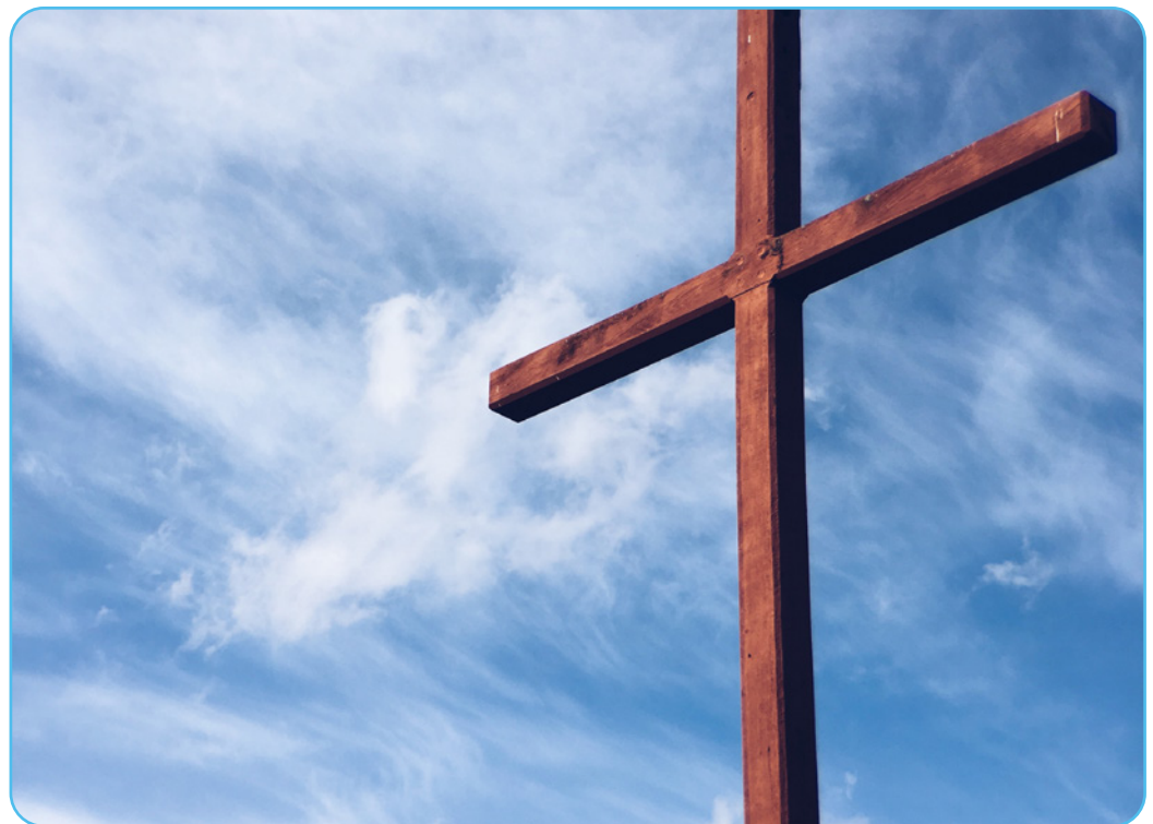
Figuur 1.8 Kruis

Jezus voelde ook de noodzaak om zich terug te trekken en te herbronnen, net zoals wij vandaag de dag dit gevoel ook soms kunnen ervaren. Ondanks het antwoord van Jezus waarbij hij lijkt vast te houden aan een cultureel-religieuze grens, is hij wel voor rede vatbaar. Zijn houding is niet principieel. Hij laat zich raken door de nood van anderen en is bereid om zijn eigen houding te veranderen. De scheiding tussen rein en onrein wordt doorbroken met dit verhaal: op sociaal vlak (door een vrouw), op geografisch vlak (de vrouw is een vreemdelinge) en op religieus vlak (de vrouw is een heiden).