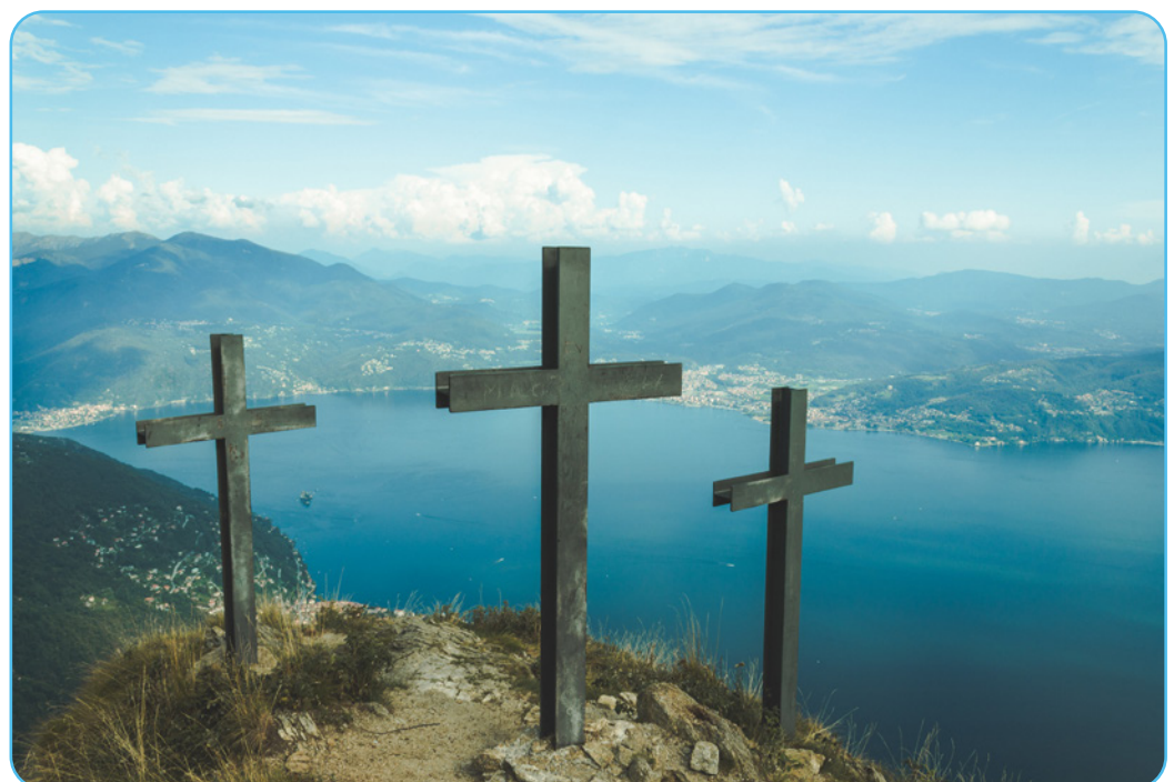
Figuur 1.7 Kruis

Samenvattend: geloven christenen dan in drie goden? Neen. Het christendom is een monotheïstische godsdienst . Christenen geloven in één God die zich openbaart in drie verschillende gedaanten. Deze gedaanten zijn onlosmakelijk met elkaar verbonden. Christenen bidden dus niet tot drie verschillende goden, maar tot één God. Dit is de Drie-eenheid, Drievuldigheid, of Triniteit. Door het maken van het kruisteken bij het begin en het einde van een gebed, verwijzen christenen naar deze Drievuldigheid van God. Daarbij zeggen ze: "In de naam van de Vader, en de Zoon, en de Heilige Geest, Amen" . Op deze manier drukken zij hun geloof in de Triniteit uit.