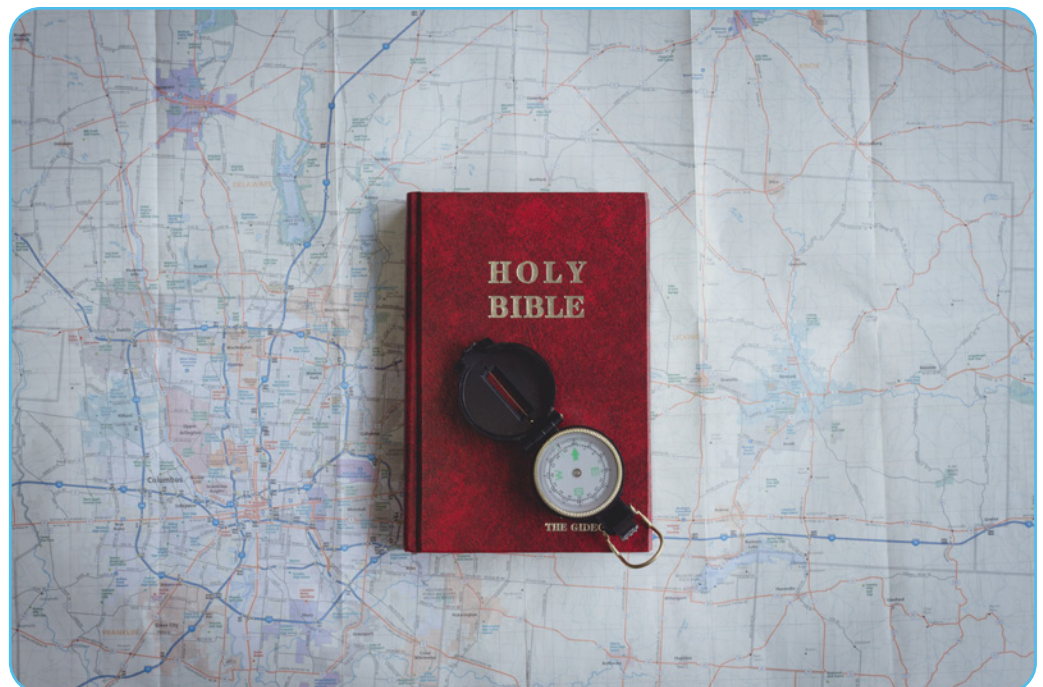
Figuur 2.8

Geef de leerlingen de opdracht om individueel, of in groep, op zoek te gaan naar al dan niet gewelddadige vormen van fundamentalistische stromingen binnen het christendom.