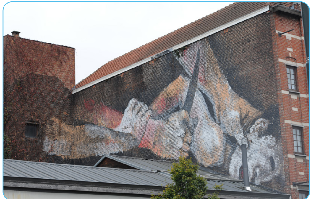
Figuur 2.5 Het offeren van Isaak street art Brussel, België

Ook vandaag blijft het offer van Isaak en het kunstwerk van Caravaggio uit 1603 inspireren. In 2017 dook er zo een muurschildering op in de Belgische hoofdstad Brussel die gebaseerd is op het werk van Caravaggio. Op de muurschildering zien we, net als op het kunstwerk van de Italiaanse schilder, een onthoofding plaatsvinden met een mes. De gelijkenis met het werk van Caravaggio is treffend. De (controversiële) muurschildering uit 2017 werd echter niet door iedereen gesmaakt en deed veel stof oplaaien omdat het zou oproepen tot geweld.