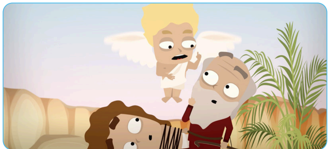
Figuur 2.3 Het beeldfragment