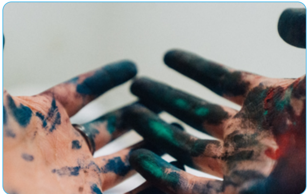
Figuur 2.7

Laat de leerlingen op zoek gaan naar andere kunstwerken die het offer van Isaak als uitgangspunt nemen.