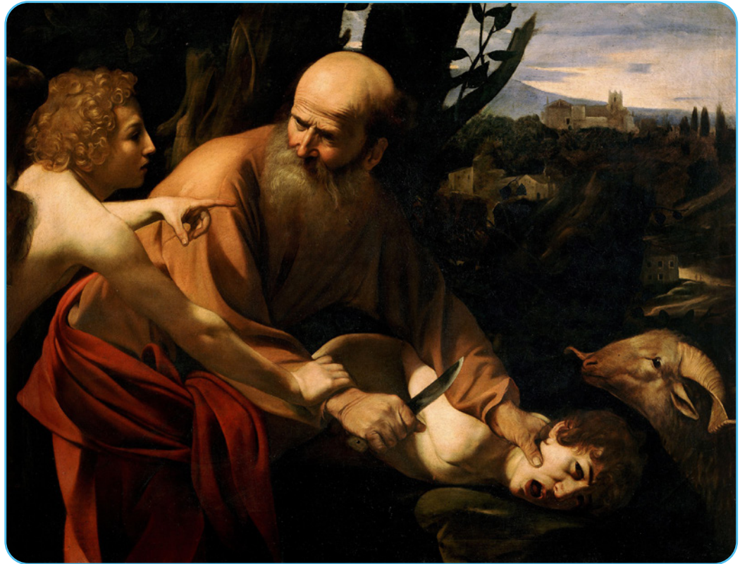
Figuur 2.4 Caravaggio – 'Het offeren van Izak' (1603)

De Italiaanse kunstenaar Caravaggio , of Michelangelo Merisi, werd geboren in 1571 en stierf in 1610. Hij was één van de beroemdste kunstenaars uit de stijlperiode van de barok. Zijn schilderij, Het offeren van Izak , dateert uit 1603. Hij maakte dit werk wellicht in opdracht van kardinaal Barberini, de latere paus Urbanus VIII (1623-1644).