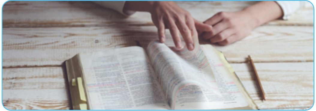
Figuur 2.2

Wat betekent het om een Isaakoffer te brengen? Bij een symbolische lezing van het Bijbelverhaal over het offer van Isaak kunnen we onszelf ook afvragen of wij vandaag al dan niet soms een 'Isaakoffer' brengen. Mensen moeten soms zaken opofferen waar zij waarde aan hechten op bepaalde momenten in hun leven. Het opofferen van persoonlijke, belangrijke elementen kan ons doen stilstaan bij het leven en onszelf in vraag doen stellen. Wanneer zo'n momenten voor een gelovige voorvallen, kan dit het eigen mensbeeld maar ook het eigen Godsbeeld in vraag doen stellen.