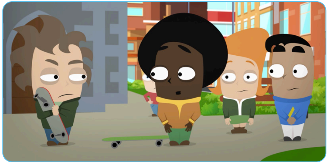
Figuur 2.1 Het beeldfragment

Michael, Pieter-Jan, Sarah en Ahmed zijn samen aan het skaten. Op een gegeven moment schuift Michael uit en botst hij tegen Pieter-Jan. Door deze botsing breekt het wiel van Pieter-Jan zijn skateboard af. Vervolgens komt het tot een conflict tussen Michael en Pieter-Jan. Pieter-Jan denkt dat Michael zijn skateboard met opzet heeft gebroken. Pieter-Jan beschuldigt Michael ervan altijd gewelddadig te handelen omdat hij katholiek is, en hij verwijst naar een verhaal uit de Bijbel waarin een vader zijn eigen zoon moet vermoorden. De vrienden gaan op zoek naar het verhaal, genaamd 'het offer van Iszaak', en ontdekken de ware betekenis ervan.