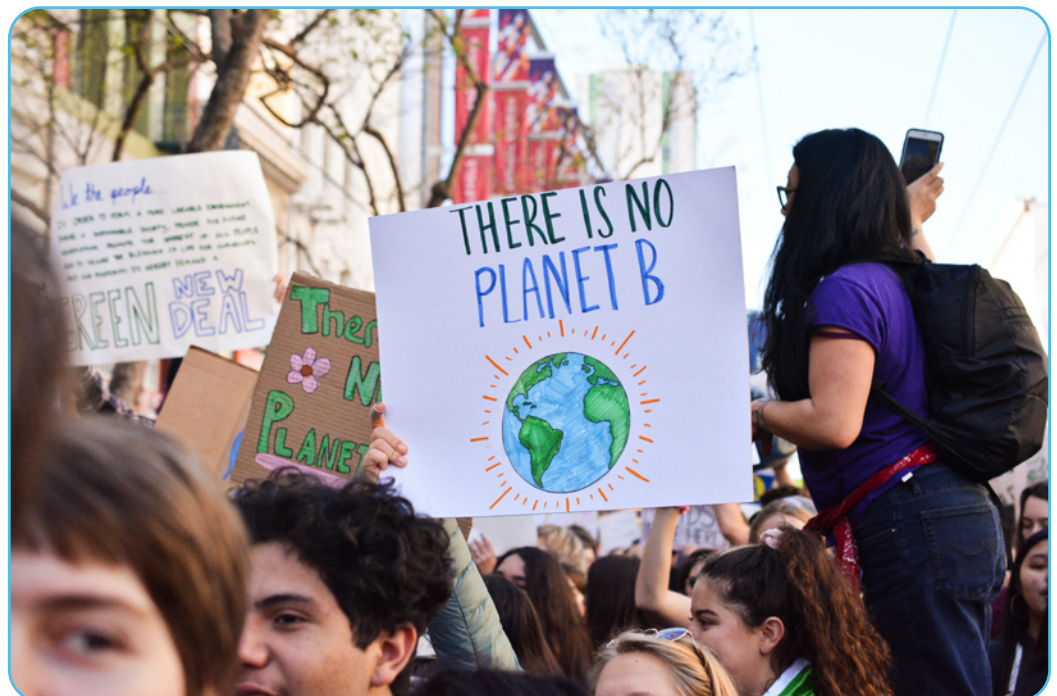
Figuur 3.6