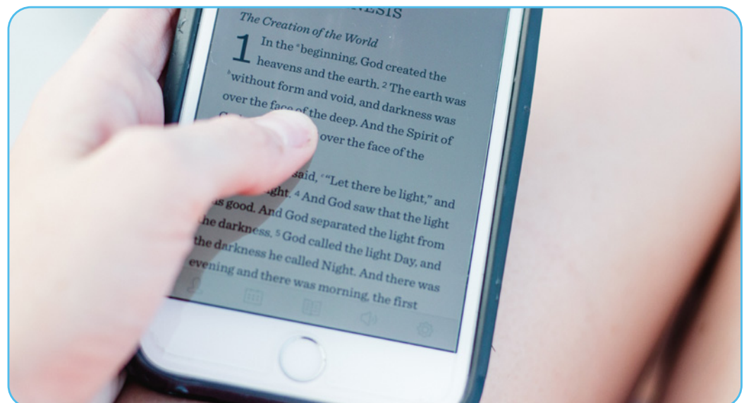
Figuur 3.4

Bij een symbolische lezing van Bijbelverhalen is niet alleen de ontstaanscontext van belang, maar ook de hedendaagse context waarin het verhaal gelezen wordt. Dit wordt ook wel recontextualisering genoemd. Bij recontextualisering worden aspecten van het christelijk geloof, zoals Bijbelverhalen, met een hedendaagse bril bekeken waarbij de interactie tussen tekst en context kan leiden tot nieuwe interpretatiemogelijkheden.