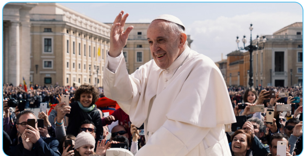
Figuur 3.7 Paus Franciscus

Op 18 juni 2015 verscheen de encycliek Laudato Si' – "Geprezen zijt Gij!" – geschreven door paus Franciscus. Deze encycliek is een oproep van de paus aan alle katholieke gelovigen en mensen van goede wil om zorg te dragen voor ons gemeenschappelijk huis . De schepping staat vandaag immers onder druk door vervuiling, het verlies van biodiversiteit, watertekorten, een steeds groter wordende kloof tussen arm en rijk, enzovoort. De encycliek belicht de huidige milieuproblematiek. Paus Franciscus roept niet alleen overheden en bedrijven, maar ieder individu op om meer zorg te dragen voor de aarde. Hij pleit met Laudato Si' voor een mondiale aanpak van het klimaatprobleem en een integrale ecologie en roept iedereen op om op zoek te gaan naar doortastende antwoorden op de klimaatcrisis.