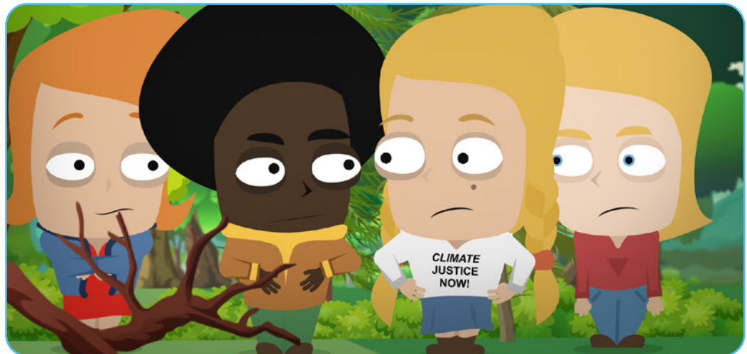
Figuur 3.2 Het beeldfragment