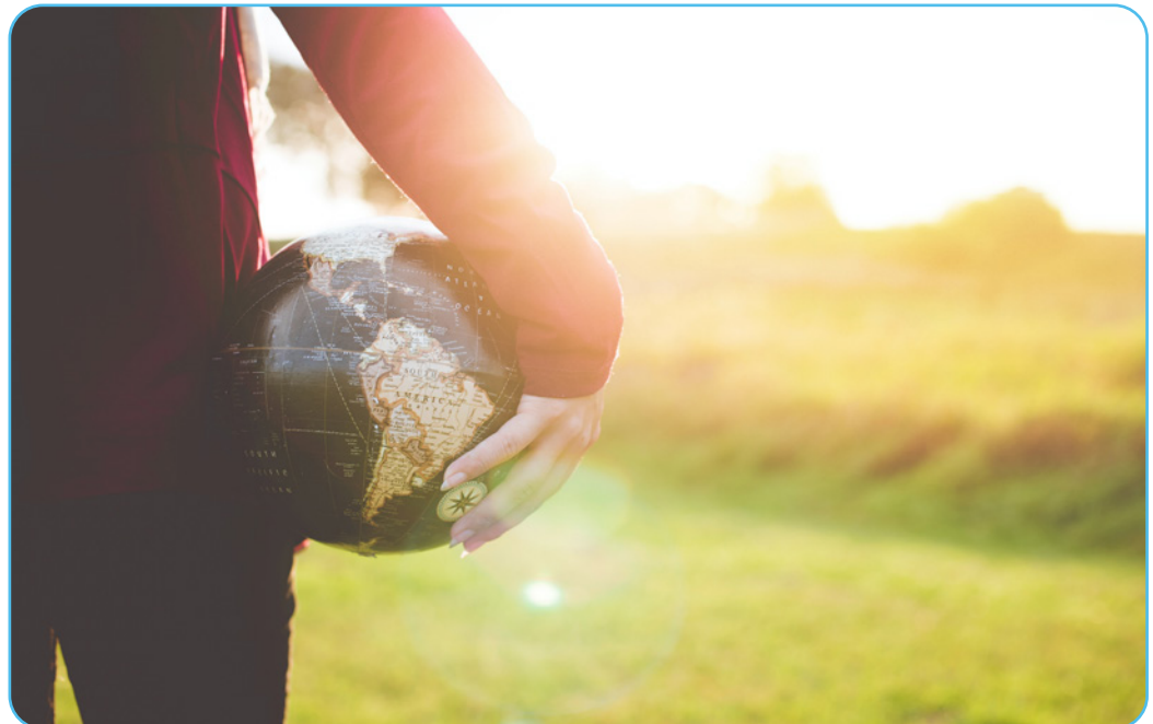
Figuur 3.3

De gevolgen van de klimaatverandering zijn geen ver-van-mijn-bed-show. Ook op lokaal vlak hebben vervuiling, een slechte lucht- en waterkwaliteit een negatieve impact op de woonomgeving, de gezondheid en de levensverwachting van mensen. Net als bij de grootschalige gevolgen van de klimaatcrisis, zijn op lokaal niveau de meest kwetsbaren uit de samenleving vaker het slachtoffer van deze problematiek, en dit zowel op mentaal als op fysiek vlak. Klimaatverandering werkt met andere woorden sociale ongelijkheid in de hand. Niet alleen dwingt de milieuproblematiek ons tot een betere zorg voor de rijkdom van de natuur, ook een globale aanpak van deze problematiek is van onmiskenbaar belang in het streven naar een mondiale sociale rechtvaardigheid.