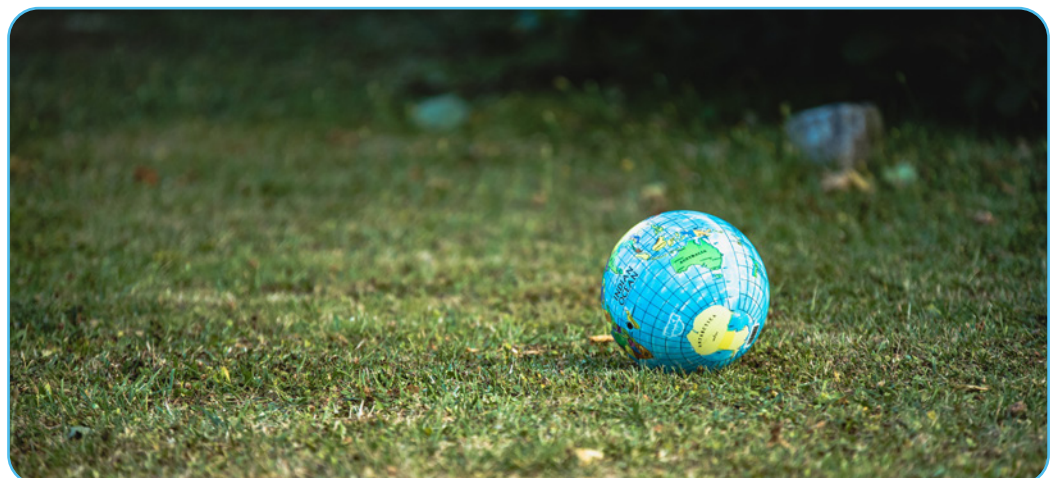
Figuur 3.1

In deze handleiding kan de leerkracht rond verschillende onderwerpen werken die aansluiten bij het overkoepelende thema 'De ontmoeting met de leefomgeving: sociale en ecologische vraagstukken'. Aan de hand van impulsen en didactische suggesties is het mogelijk om vanuit verschillende perspectieven dit thema te benaderen. Impulsen zijn elementen die de leerkracht in de klas kan binnenbrengen om het gesprek op gang te brengen. Deze handleiding bevat een diversiteit aan impulsen met verschillende moeilijkheidsgraden. Deze impulsen hebben als doel om bij te dragen tot het leerproces en bestaan in verschillende vormen. Het is niet de bedoeling om alle impulsen te gebruiken. De leerkracht kan de meest passende impulsen selecteren op basis van (de beginsituatie in) zijn leergroep. De didactische suggesties zijn concrete voorstellen om met de impulsen aan de slag te gaan en zijn gericht op levensbeschouwelijke reflectie en communicatie. Dit zorgt ervoor dat de leerkracht op een gevarieerde manier de verschillende impulsen, die aansluiten bij de eigen leergroep, kan benaderen.