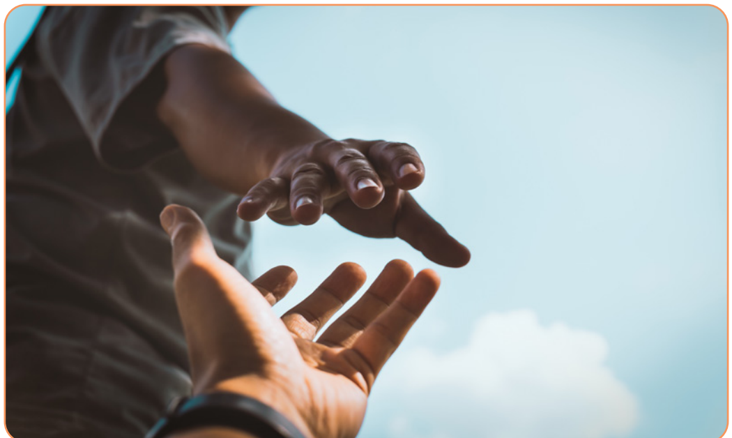
Afbeelding 1.2

Het contrast tussen de roeping van Abraham (joden) en de praktijk van Sodom kan niet groter zijn: rechtvaardigheid als zending tegenover onrecht als praktijk, morele excellentie tegenover immoraliteit.