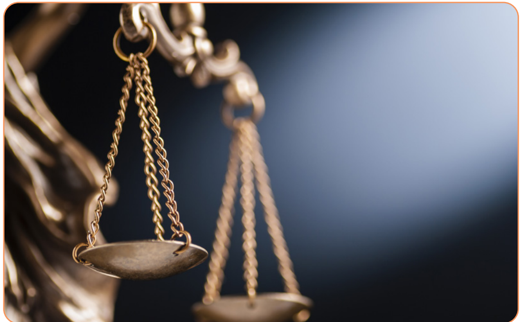
Afbeelding 1.4

OPDRACHT. Samen met de leerlingen kan nagedacht worden over (historische) voorbeelden van mogelijke tzadikim nistarim .