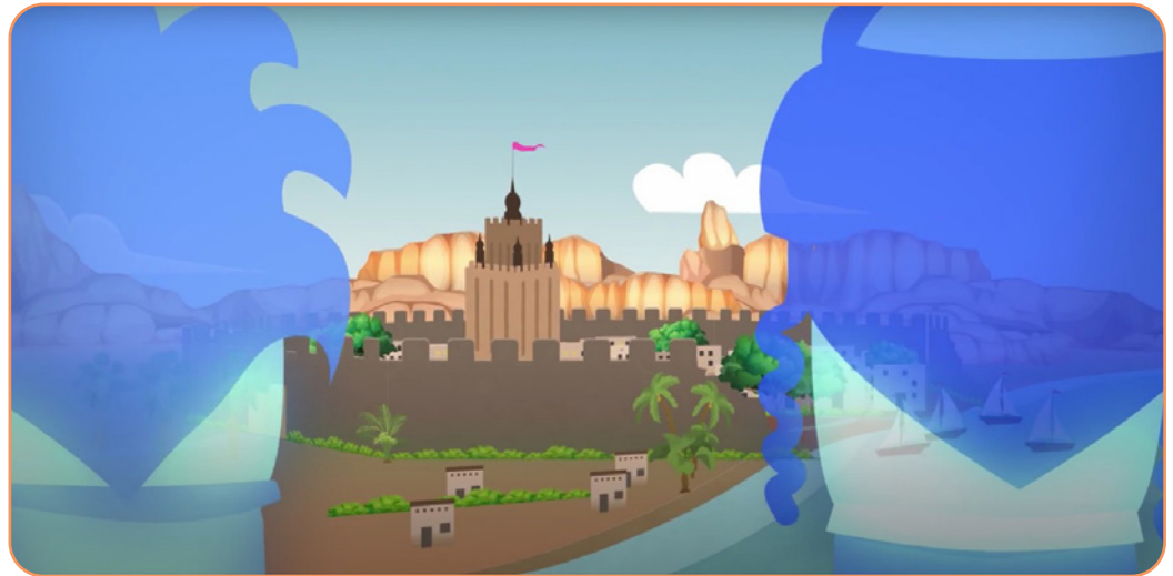
Afbeelding 1.1 De videoclip