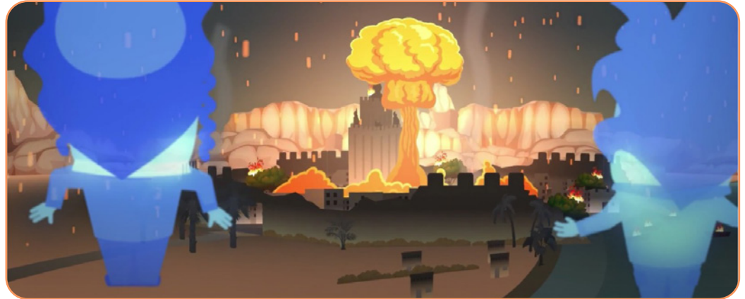
Afbeelding 1.3 De videoclip