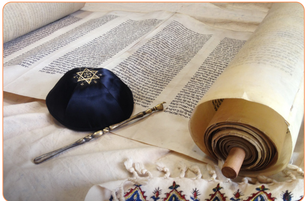
Afbeelding 4.4