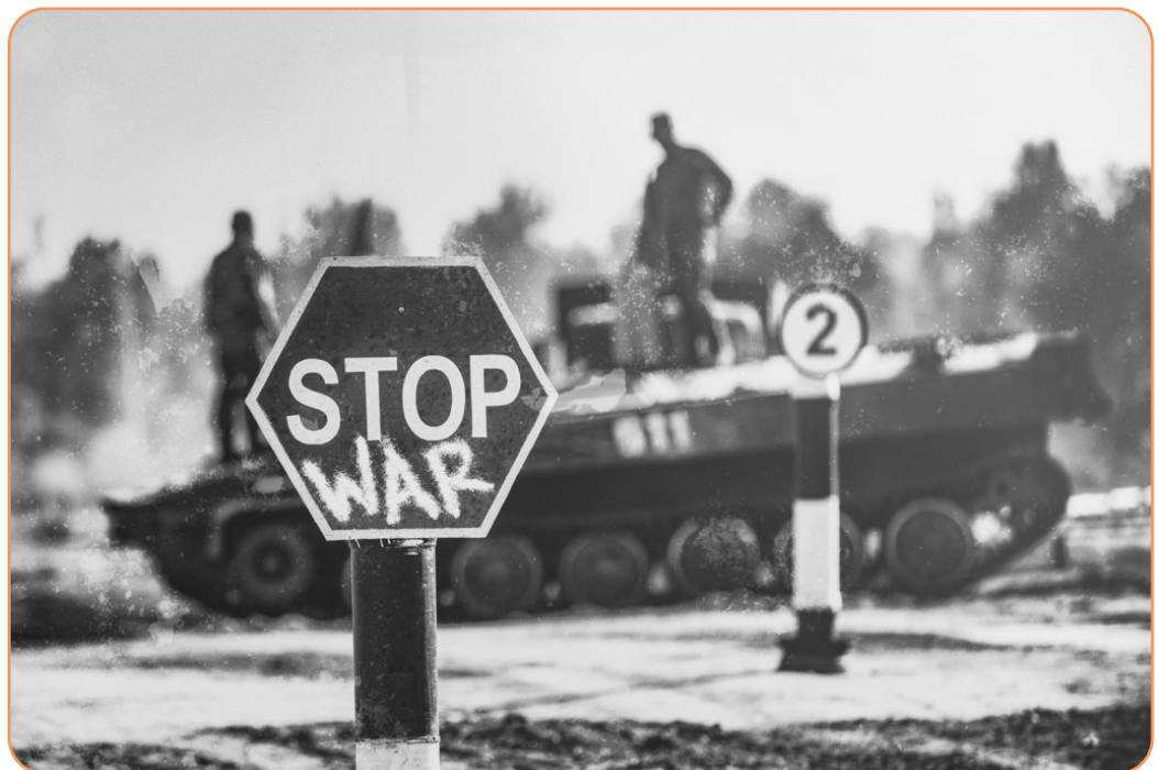
Afbeelding 4.3

De klas kan in twee groepen worden opgedeeld. Een groep zoekt argumenten pro oorlogsvoering, de andere zoekt argumenten contra. De leerlingen voeren de discussie en proberen tot een conclusie te komen. De verdiepende leerstof over het IHR en/of Fackenheim's 614e gebod kunnen als aanvulling dienen voor de discussie.