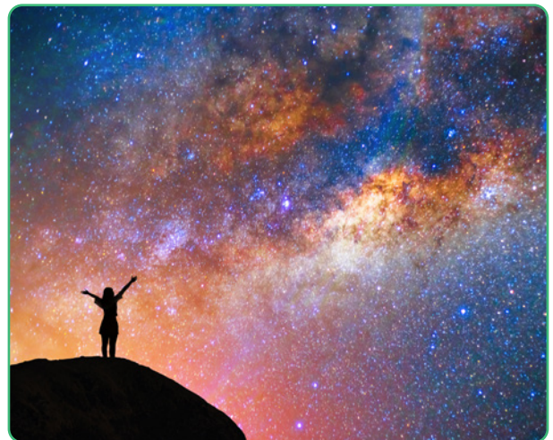
Figuur 3.1

Er is een onderling verband tussen alle elementen van de schepping. Ook bracht Allah hier structuur in. Daarom spreken we van een schepping die in balans is of mizan zoals uitgelegd in de Koran: “De zon en de maan volgen de berekende baan. En de planten en de bomen knielen zich neer. En Hij heeft de hemel hoog opgeheven en Hij heeft de weegschaal (der gerechtigheid) geplaatst. Opdat jullie het evenwicht niet verstoren. En Hij houdt de weegschaal in evenwicht met rechtvaardigheid, en breng geen afwijkingen in het evenwicht.” 4 (Ar-rahmane: 5,6,7,8 en 9)