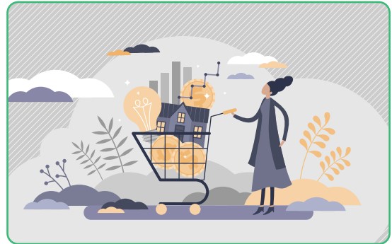
Figuur 3.6

De mens consumeert zeer veel. Heel vaak wordt er meer verbruikt dan we als mens effectief nodig hebben om te overleven, denk aan de voedseloverschotten die na elke maaltijd weer in de vuilbak belanden. Het is belangrijk om een balans te vinden in die consumptie. Zelfs indien er nu nog een overvloed zou zijn aan bepaalde natuurlijke bronnen, zou het niet rechtvaardig zijn om die te verkwisten en onnodig uit te putten.