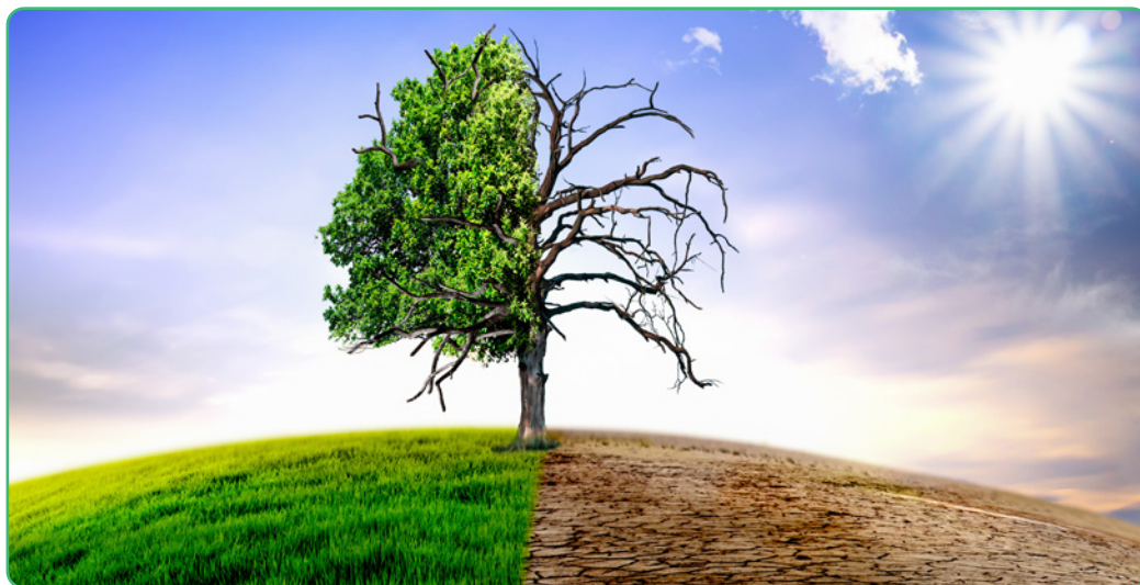
Figuur 3.7

Zoals reeds verteld geeft de natuur via deze natuurfenomenen signalen of ayats om aan te tonen dat het evenwicht is verstoord. Ook in het kader van de klimaatveranderingen is het dan aan de mens om zich steeds als khalifa te gedragen en dat evenwicht proberen te herstellen door duurzaam en milieu-verantwoord gedrag te vertonen.