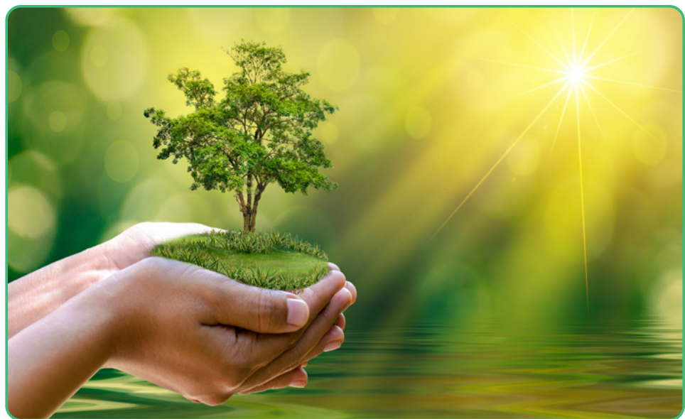
Figuur 3.2

Ook geeft de natuur signalen of ayats wanneer het niet goed gaat. Het is dan aan de mens om daarmee rekening te houden en de natuur nog beter te beschermen. Zoals reeds uitgelegd maakt de mens samen met alle andere scheppingen deel uit van het gehele universum. Toch verschilt de mens van alle andere scheppingen omdat het beschikt over de rede of het verstand en de vrije wil. Mensen hebben de capaciteit om na te denken over hun handelingen en te kiezen of ze iets al dan niet doen/beschermen/behoeden. In tegenstelling tot dieren die hun instinct volgen, beschikt de mens dus over het verstand om de opgelegde taak tot bescherming van de natuur te begrijpen en uit te voeren. 7