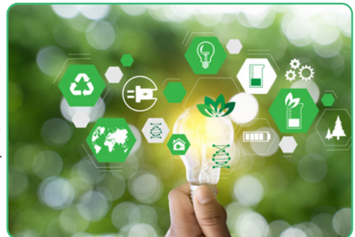
Figuur 3.3

Al de rijkdommen van de aarde (land, water, lucht, wouden, ertsen, enz.) zijn beschikbaar om door de mens gebruikt te worden, maar zijn niet van de mens. God heeft ze voor de mens geschapen, het zijn geschenken voor de mens waarop ethische beperkingen gelden. De mens kan ze gebruiken om zijn noden te lenigen maar enkel op een manier die het ecologisch evenwicht niet verstoort en die de mogelijkheid van toekomstige generaties om in hun behoeften te voorzien niet compromitteert. Vervuiling en verspilling van natuurlijke rijkdommen is verboden.