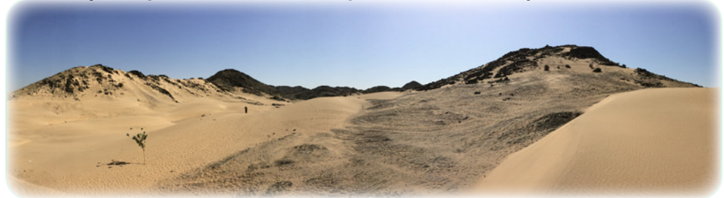
Figuur 6.4

Daar valt een zeer belangrijke spirituele lering uit te trekken, zowel wat betreft de vorming van de Profeet zelf als onze eigen vorming door de eeuwen heen. Leven in de natuur, respect ervoor, alsook het kijken naar en nadenken over wat zij ons laat zien, ons te bieden heeft en van ons (terug)neemt zijn eisen van een geloof dat zich in zijn zoektocht wil voeden en verdiepen. De natuur is een school waarvan de geest geleidelijk aan de tekenen en betekenis leert begrijpen. De natuur is de eerste gids en intieme gezelschap van het geloof. Ver verwijderd van de zielloze religieuze rituelen zorgt deze soort educatie voor een relatie met het goddelijke gebaseerd op contemplatie en dieptegang die later een tweede fase van spirituele educatie mogelijk zal maken. In een tweede spiritueel leermoment kunnen dan de betekenis, vorm en de doelen van het religieuze ritueel begrepen worden. Ver weg van de natuur, in onze steden, lijken we de betekenis van deze boodschap vergeten te zijn, zozeer dat we een gevaarlijke omkering van de volgorde van de geloofsverplichtingen maken en denken dat het leren van technieken en vormen (gebeden, bedevaarten, ...) voldoende is om hun betekenis en doelen te bevatten en te begrijpen. Dit is een vergissing met grote gevolgen want uiteindelijk zorgt dit ervoor dat het godsdienstonderwijs zo wordt ontdaan