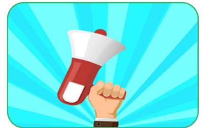
Figuur 6.1

Deze vrijheden worden uitdrukkelijk beschermd door democratische rechtstaten bijvoorbeeld in artikel 19 van de Belgische Grondwet alsook in artikel 9 en 10 van het Europees Verdrag voor de Rechten van de Mens. Dit betekent concreet dat ieder individu zonder angst om vervolgd te worden uiting kan geven aan zijn overtuiging.