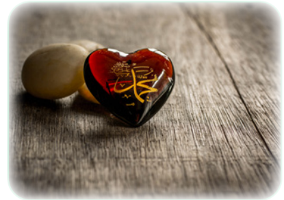
Figuur 6.3

Tijdens de geboorte werd zij opgedragen om te zeggen: "Ik plaats hem onder de bescherming van de Enige tegen de valsheid van alle afgunstigen". De Quraish, de stam waar ook de Banu Hashim deel van uitmaakten, hadden een speciale relatie met de nomadische levensstijl van de Arabische bedoeïenen. Ze vertrouwden hun jongens toe aan de zorg van bedoeïen pleegfamilies. Ze geloofden dat de bedoeïenen een vrijere, gezondere en nobelere levensstijl hadden dan zij die in de stad woonden. Om een succesvol leven te hebben in de woestijn is een hoog niveau van solidariteit nodig en bijgevolg ook een groot niveau van respect voor de persoonlijkheid en appreciatie van de menselijke waarde.