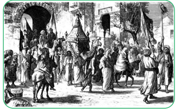
Figuur 6.5

Toen de profeet Mohammed de openbaring ontving en die publiekelijk ging verkondigen botste hij op weerstand van stamhoofden van Mekka. Ze raakten iedere dag meer doordrongen van het gevaar dat op de loer lag: het was volgens hen een opstand tegen hun goden en hun gewoontes. Dit kon hun macht op termijn in gevaar brengen.