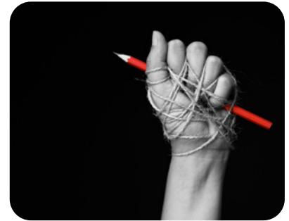
Figuur 6.2

Toch kan men niet zomaar altijd alles naar believen zeggen of schrijven. Aanzetten tot racisme, vreemdelingenhaat, eerrovende, lasterlijke of beledigende uitingen, haat of geweld zijn strafbaar.