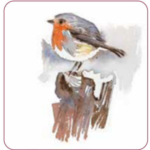
Figuur 3.3 Aquarelle door Vaso Gogou

10 Tot de aarde komt Gij, geeft haar groei­kracht, rijkdom geeft Gij die zich ver­meer­dert: want de beek van Gods regen vloeit over. Zo geeft Gij het graan zijn begin, schept Gij het begin op de akker, 11 drenkt de voren, effent het ploegland, maakt met zware regens het willig. En Gij zegent wat gaat ontkiemen. 12 En dan kroont Gij het jaar met uw gaven;