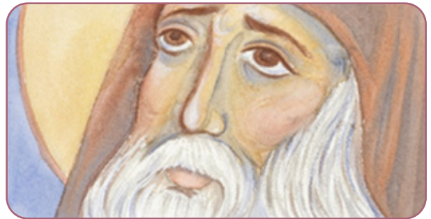
Figuur 3.7 De heilige Porphyrios van Kafsokalivia, icoon van de heilige Porphyrios in het klooster van Panagia Eleousa, Achaëa, Griekenland door Peloponnisios via Wikimedia Commons. Gelicentieerd onder de Creative Commons Naamsvermelding- GelijkDelen 4.0 Internationaal licentie. De afbeelding is niet gewijzigd en kan worden gevonden op https://upload.wikimedia.org/wikipedia/commons/ thumb/d/d0/Saint_Porphyrios.jpg/800px- Saint_Porphyrios.jpg

De Heilige Silouan van de Athos hield niet alleen van mensen, maar ook van de hele schepping van God. Kijkend naar de blauwe lucht en de witte wolken, zei hij: "Hoe groot is onze Heer en hoe prachtig heeft Hij alles gemaakt! Zijn glorie is duidelijk zichtbaar in alle dingen om ons heen. Het enige wat we is voor hen allemaal zorgen, met liefde. We moeten Hem vreugdevol verheerlijken vanwege Zijn rijke gaven. Het hart dat heeft geleerd lief te hebben, treurt om de hele schepping, zelfs om een klein groen blad als het zonder noodzaak wordt afgebroken."