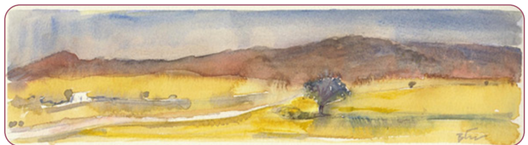
Figuur 3.5 Aquarelle door Vaso Gogou

Er kan een uitweg zijn als we begrijpen dat misbruik van de schepping een zonde is. Daarom moeten we ons bekeren, dat wil zeggen de manier veranderen waarop we over God, de wereld en onszelf denken. Dit is de letterlijke betekenis van het Griekse woord "berouw" of 'metanoia', dat is samengesteld uit 'boven' (meta) + het 'verstand' (nous). Het wil zeggen: ik verander mijn manier van denken en mijn manier van leven. Dus deze verandering betekent in de praktijk het verminderen van overdadigheid en overconsumptie door terughoudendheid en ascese.