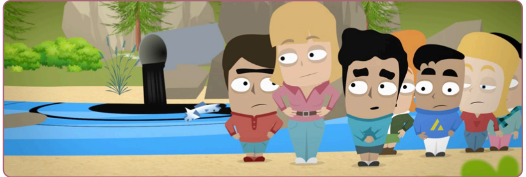
Figuur 3.1 Het beeldfragment

In dit deel bekijken de leerlingen een video en beantwoorden ze de vragenlijst voor de eerste keer. Op die manier krijgen ze een eerste indruk en beeld van het plot van de video en de inhoud.