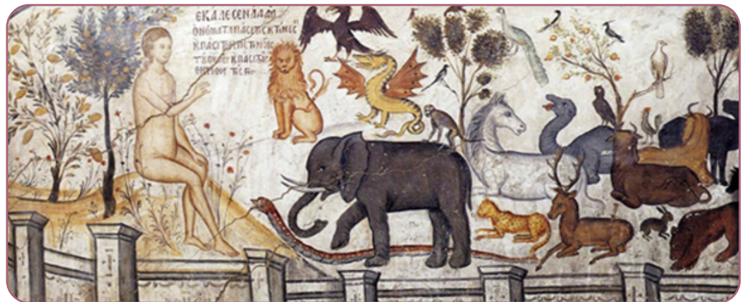
Figuur 3.4

Heerschappij betekent hier niet dat de mens de schepping overheerst met egoïsme en onderdrukking, maar de mens, als een beeld van God, moet zichzelf uitdrukken met vriendelijkheid en barmhartigheid, net zoals God dat doet. De natuur moet door de mens worden gezien als een persoon, dat wil zeggen als een 'jij' en niet als een onpersoonlijk en neutraal 'het'. Daarom wordt de mens door God gevraagd priester van de schepping te worden, d.w.z. om de wereld in eigen handen te nemen, te transformeren en als een offer aan God terug te geven.