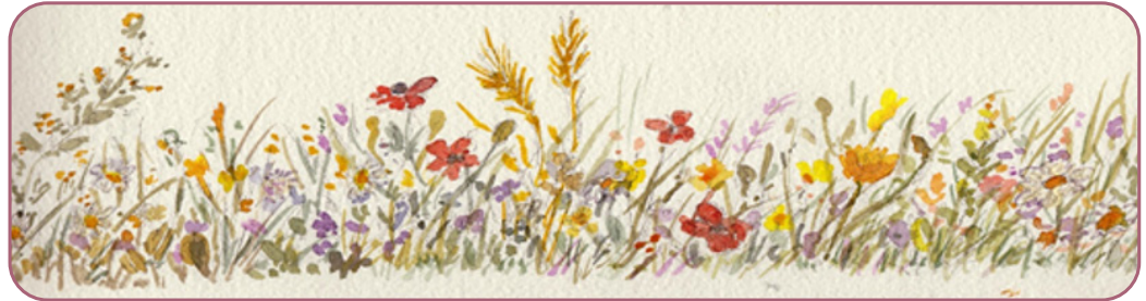
Figuur 3.2 Aquarelle door Vaso Gogou

8 Daarna legde de heer God een tuin aan in Eden, ergens in het oosten, en daarin plaatste Hij de mens die Hij geboetseerd had. [...] 15 Toen bracht de heer God de mens in de tuin van Eden, om die te bewerken en te beheren.