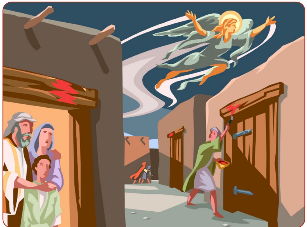
Afbeelding 2.2 God slaat de Israëlieten over.

Op Pesach volgde het feest van het ongezuurde brood . Deze werd al aan het begin van de eerste eeuw ook Pesach genoemd Het feest van de ongezuurde broden diende als een hereniging aan deze eerste dag van de uittocht. Het brood was ongezuurd, omdat het volgens Exodus in haast moest worden bereid en opgegeten.