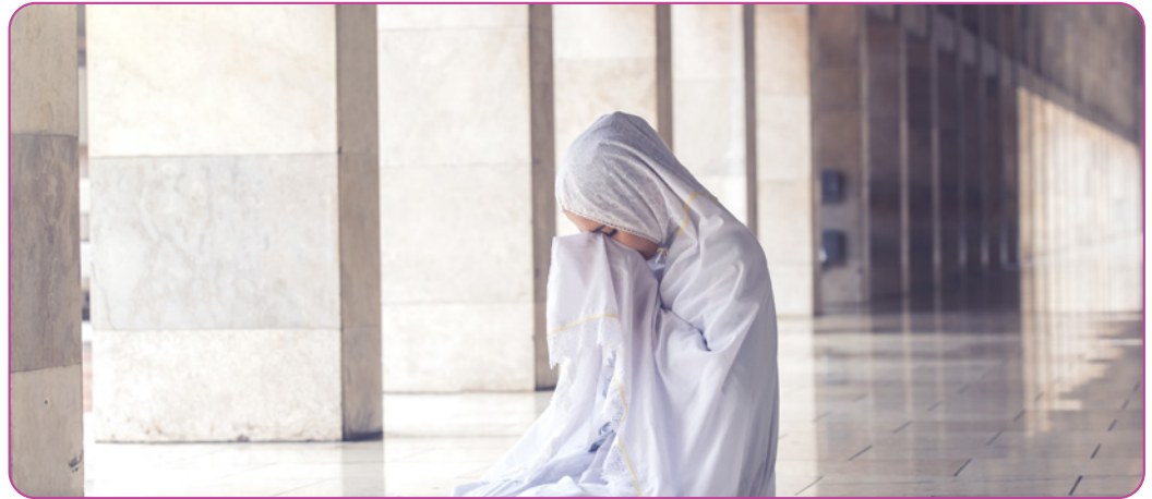
Figuur 3.3

Zoals vermeld in het verhaal van Samir, bidden moslims vijf keer per dag en putten ze er veel kracht uit. De gebedshouding drukt eerbied uit voor God en menselijke onderwerping aan God. Het gebed bestaat uit een aantal houdingen: Staand, bukken en knieling. Op een voorgeschreven rituele wijze worden deze vormen tijdens elk gebed uitgevoerd. De ultieme uitdrukking van onderwerping is het moment in het gebed waarop men neerknielt en met het voorhoofd de grond aanraakt. Het hele ritueel wordt afgesloten met een hoofdbeweging van rechts naar links.