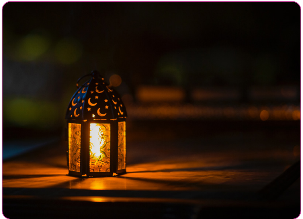
Figuur 3.1

Het grootste aantal van de moslimbevolking is geconcentreerd in Afrika en Azië. Er zijn ook moslims in Europa -vooral in Oost-Europese landen- zoals Kosovo, Albanië en Bosnië en Herzegovina. De islam is de grootste wereldgodsdienst. Door de grote migratiestromen in de jaren 1950 en 1960 heeft de islam zich, vooral via Marokkanen en Turken, in West-Europa gevestigd.