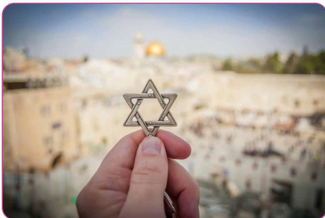
Figuur 1.3 Hand met een Davidsster, een joods religieus symbool tegen de westelijke muur van de joodse tempel in de Oude Stad van Jeruzalem