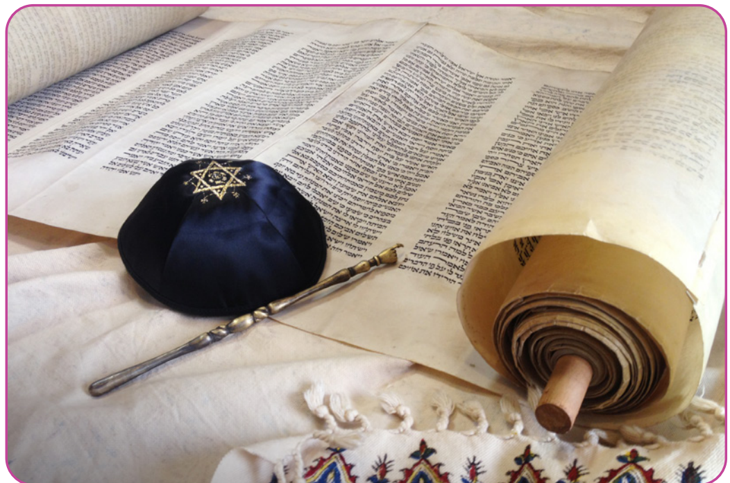
Figuur 1.2 Torarol met Kippah