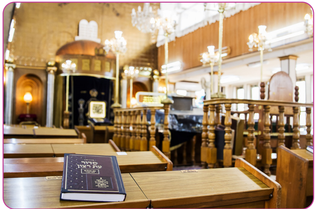
Figuur 1.1 Het interieur van de synagoge Brahat ha-levana in Bnei Brak, Israël.

Onze synagoge speelt een zeer belangrijke rol in mijn joodse gemeenschap. Ik en mijn familie gaan elke keer, en dat is drie keer per week . In het midden van de synagoge is een bima . Het is moeilijk te beschrijven... Het is een soort verhoogd platform! Daarop zitten een paar belangrijke mensen voor onze diensten. Een van hen is de chazan . Hij zingt en reciteert veel van de gebeden. Hij leidt de synagoge dienst! Er is ook de baal keriah , die voorleest uit de Thorarol. Dat is zo moeilijk, dat er zelfs een speciale opleiding voor bestaat. De Thora moet naar de bima gedragen worden vanuit een veilige opslagruimte. Wij noemen deze opslagruimte de Ark van de Thora , of Heilige Ark . Er hangt een parochet voor, dat is een prachtig versierd gordijn. Deze synagogedienst is een speciale gelegenheid, omdat ik deel mag uitmaken van het minyan . Dat is een speciaal koor dat bestaat uit tien volwassen mannen . Ik heb vorige week mijn bar mitswa gehad, dus ik ben eindelijk oud genoeg om er deel van uit te maken! Sommige gebeden kunnen alleen door ons worden gereciteerd. Mijn zus zou er ook graag bij willen zijn, maar in onze synagoge mag dat niet. Het is een halachische regel!