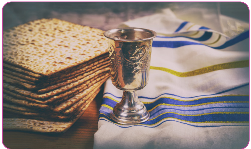
Figuur 1.2 Pessach wijn en matse, Joods feest, brood, houten plank.