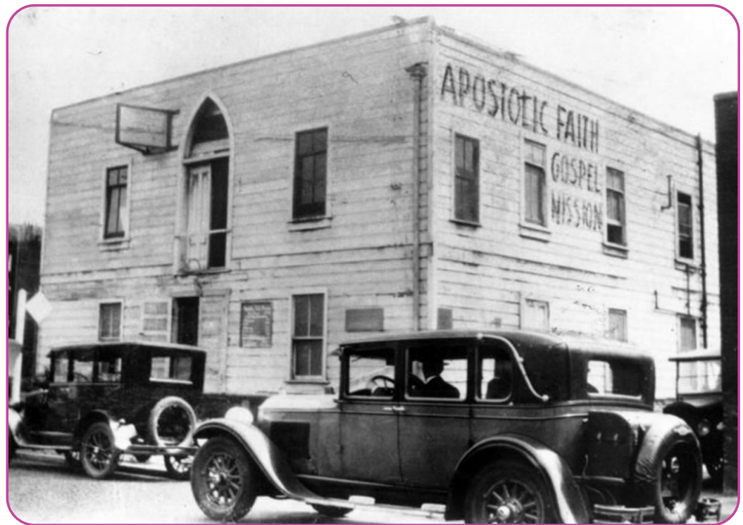
Figuur 5.5 De Apostolic Faith Mission aan de Azusa Street, wordt gezien als de geboorte plaats van de Pinksterbeweging

Het doel van deze vraag is om de leerlingen na te laten denken over hun standpunten over een centraal thema binnen de pinksterbeweging, namelijk het bovennatuurlijke.