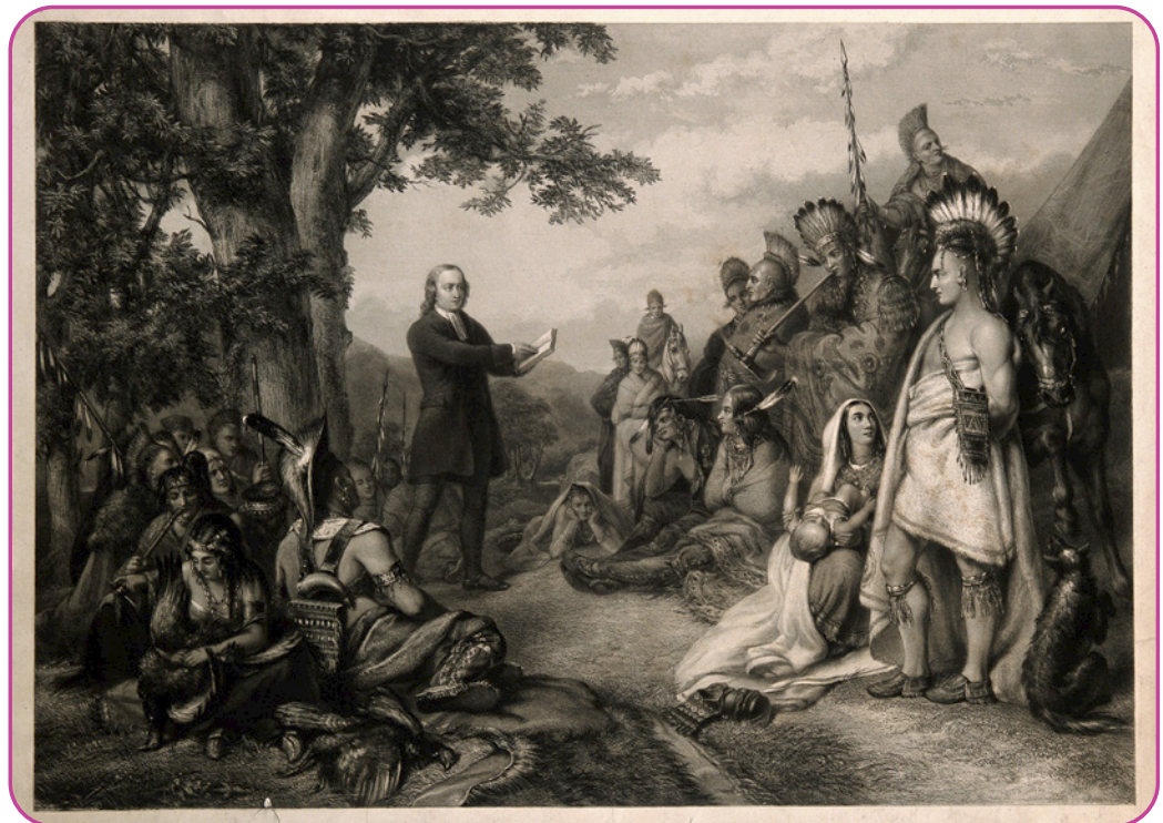
Figuur 5.3 Gravure van John Wesley die predikt tot inheemse Amerikaanse bewoners

Het doel van deze opdracht is dat de leerlingen reflecteren op wat zij belangrijk vinden in hun leven. Dit kan gebaseerd zijn op een religie of een moreel principe of kan iets zijn wat de leerlingen motiveert en een doel geeft. Ze worden aangemoedigd om middels deze centrale principes te tonen wat ze als personen echt belangrijk vinden.