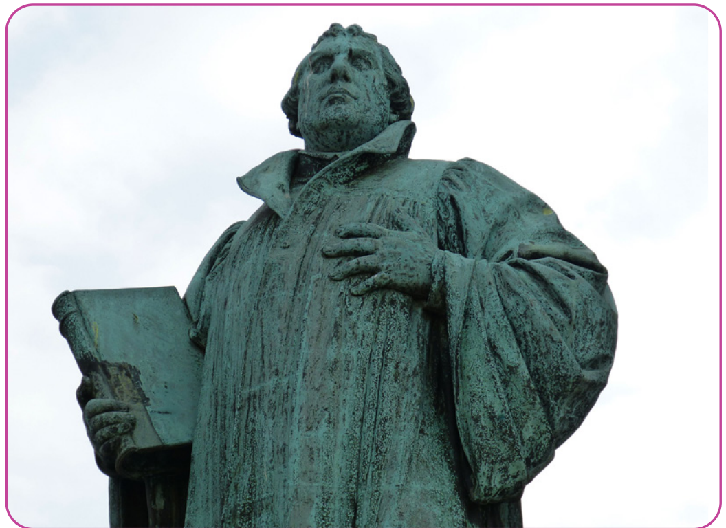
Figuur 5.1 Standbeeld van Maarten Luther