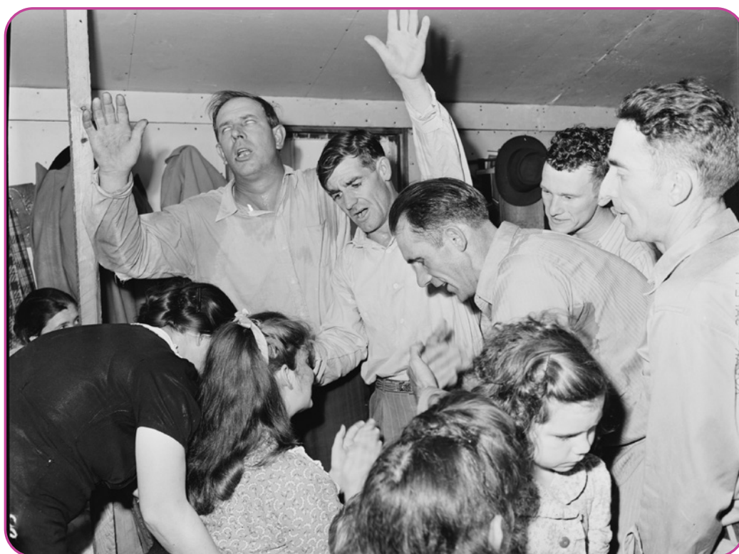
Figuur 5.4. Handoplegging in de Church of God in Lejunior Kentucky op 9 mei 1946

Een belangrijk begrip om over te bespreken is bovennatuurlijk, het verwijst naar alles wat niet past in onze gemeenschappelijke perceptie van de natuurwetten. De aanwezigheid van het bovennatuurlijke is zeer belangrijk in de pinksterbeweging. Hieronder staat een zwart-wit foto van mensen die bidden voor goddelijke genezing voor een vrouw in een rolstoel. Niet alle protestanten geloven noodzakelijkerwijs in een God die op bovennatuurlijke wijze in de wereld werkt.